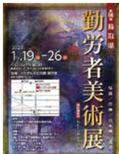
勤労者美術展ポスター