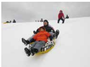
ウインターフェスティバル