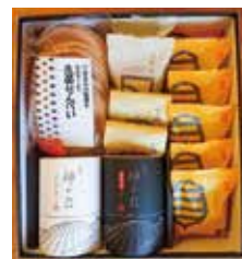
プレゼントの例(生姜と砂丘のお菓子セット)