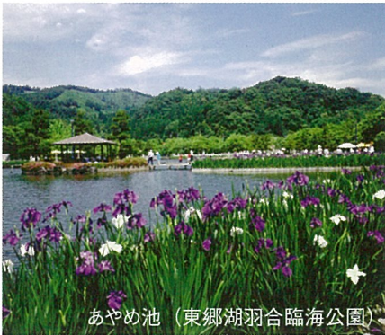
あやめ池 (東郷湖羽合臨海公園)

里山を過ぎ、林の中に入ると、木陰も多くひんやりとしてきます。案内版を見落とさなければ、道も整備されていて安心して滝まで到着できます。不動滝は、不動明王を祭る社の向こうにある荘厳な滝。今滝は更に4km歩きますが、遊歩道が整備され、景観を楽しめ、滝好きには絶好のコースです。