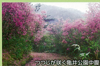
つつじが咲く亀井公園中腹