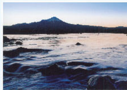
日野川フォトコンテスト2019グランプリ作品「大山さんと日野川さん」