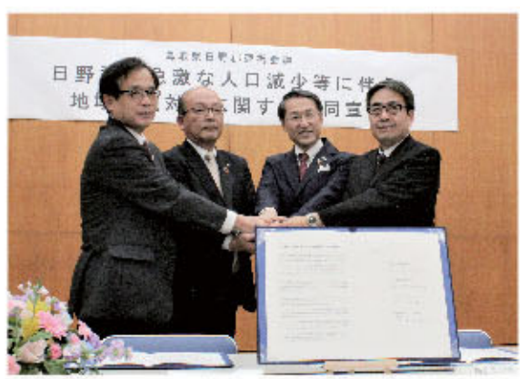
平井知事と3町長が共同宣言に署名しました。