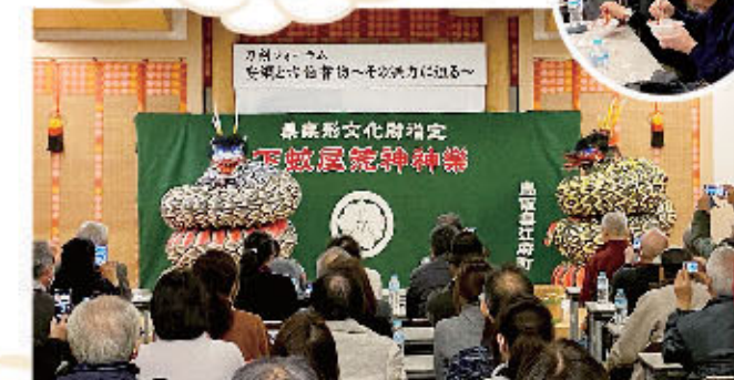
下蚊屋荒神神楽の上演

日野町振興局地域振興課 電話:0859-72-2082 FAX:0859-72-2072