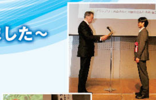
「日野川フォトコンテスト2019」表彰式

日野川の源流と流域を守る会では「会員大募集中」です。お申し込み方法や会費などについては、下記問い合わせ先までお願いします。