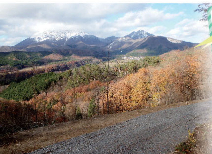
後紬線からの大山を望む眺望

令和元年秋、江府町内に林業専用道「後紬線」が、6年の歳月をかけて全線開通しました。 この後紬線は江府町御机から宮市原の苦塔トンネルまでをつなぐ延長約8kmの林道(幅員3.5m)で、森林整備を進めるために、鳥取日野森林組合と江府町が連携して開設しました。