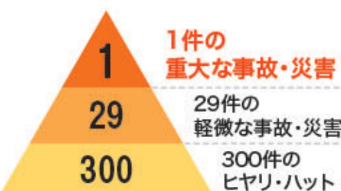
図:ハインリッヒの法則

皆さんは普段の農作業中に「危ない」と感じる場面がありませんか。このような出来事に関して、労働安全における「ハインリッヒの法則」とよばれるものがあります。この法則では1つの重大事故には軽微な事故が29あり、さらにその事故に対して300のヒヤリ・ハット(小さな危険)があるとされています。