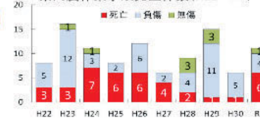
県内機械別死亡事故の割合(H19~H28)