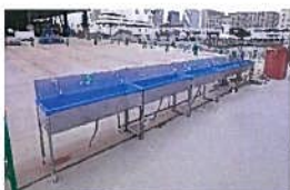
現場の手洗い場所の増設