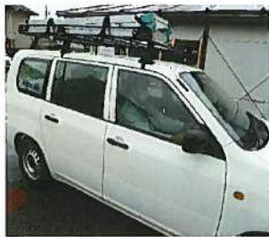
現場移動では同乗を避けて 個人で移動