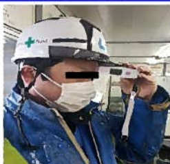
朝礼時などに体温測定を実施