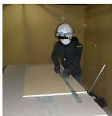
作業時のマスク着用