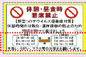
時間差による休憩時間の分散化