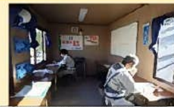
現場事務所での対人間隔の確保と換気