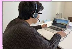
テレワークでの現場確認状況

テレワーク中の担当者でも、自宅でPC等で確認・指示・注意を行うことができ、テレワークの活用と現場における対人接触の低減に資する