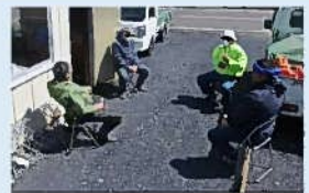
屋外で対人距離を確保して休憩