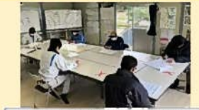
打合せ時の十分な対面距離の確保