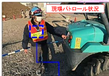
現場パトロール状況