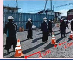
作業員間の一定距離の確保