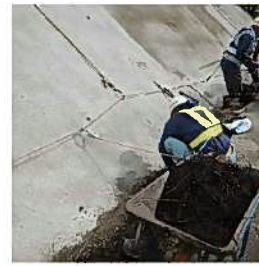
作業時なるべく離隔を確保