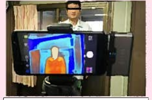
サーモグラフィカメラによる体温計測