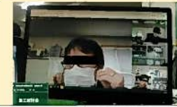
Web会議による打合せ