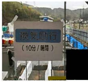
作業場所は定期的に換気する