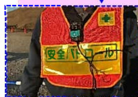
携帯Webカメラ着用状況