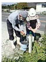
作業場所での手洗い励行