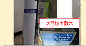
次亜塩素酸水対応の加湿器等を設置