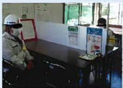
パーティションで密接を防止