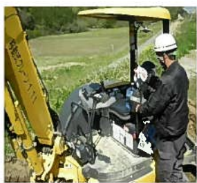
重機のレバーはこまめに消毒