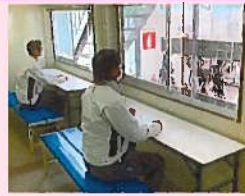
休憩室の窓の常時開放