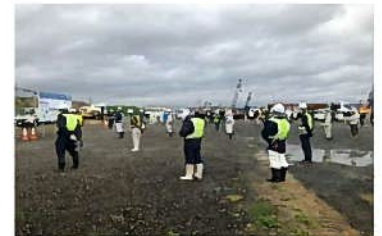
朝礼の整列時に作業員間の距離を十分に確保