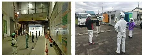
朝礼の分散化・少人数化