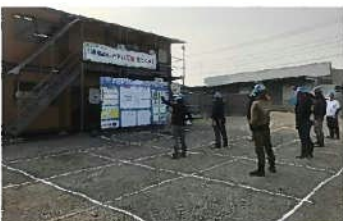
立ち位置をマーキングして配列間隔を確保