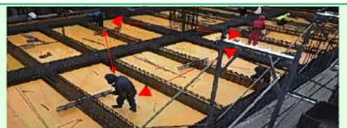
作業員の配置をブロック分けし密接した作業を回避