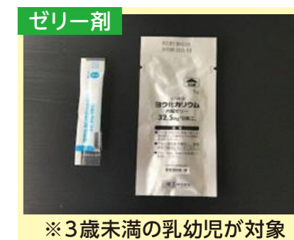
※3歳未満の乳幼児が対象

服用を優先すべき対象者は、妊婦、授乳婦及び未成年者(乳幼児を含む。)とされています。40歳以上の方は、服用する必要性は低いとされていますが、40歳以上であっても妊婦及び授乳婦は、服用を優先すべき対象者です。(参考:安定ヨウ素剤の配布・服用に当たって/令和3年7月21日原子力規制庁)