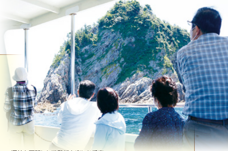
運航を再開した遊覧船を楽しむ乗客