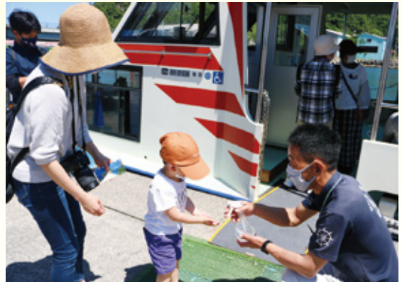
船員も乗客も感染予防を徹底。乗船前は全員アルコールで手指を消毒

遊覧船は6月に再開、念願の船長デビューも果たしました。美しい浦富海岸とともに乗船をお待ちしています。