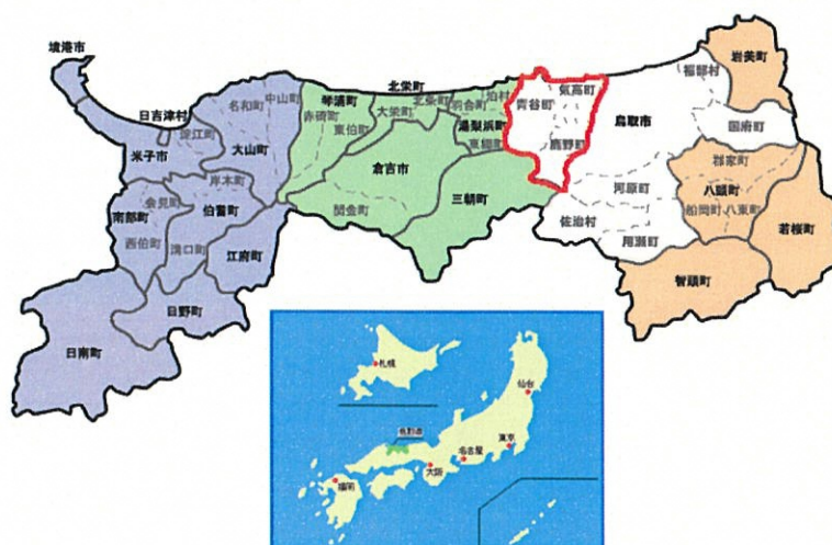
図① (引用：鳥取市自治連合会 HP)

気高町と鹿野町には河内川、浜村川、永江川が流れている。青谷町は日置川、勝部川が流れ、この2つの川は降雨期には越流により付近一帯への浸水が発生する。いずれの河川も距離が短く急流であり、水害をもたらす要因となっている。