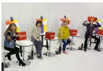
メイン声優4名のトークショー