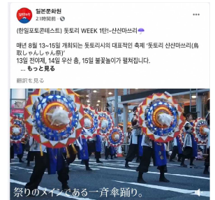
在韓国日本大使館公報文化院 Facebook

「コロナが終息したら鳥取で素敵な景色や海が見える温泉に行ってみたい」「鳥取で夫と手を繋いでお茶を飲みながら星をみたい」など