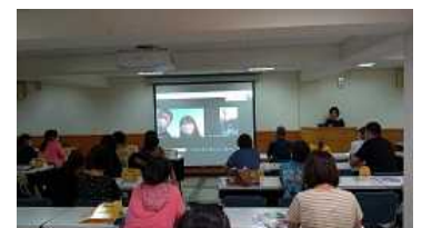
台中市観光情報説明会会場の様子

会場からは「コロナが終息したらすぐに鳥取県の旅行商品を作りたい」「コロナ感染者が少なく安心して送客できる」などのコメントあり。