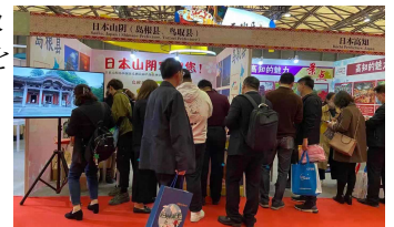
中国国際旅游交易会 2020 会場の様子

「コロナが終息したらすぐに鳥取県に旅行したい。」「カニや温泉など鳥取県には魅力的な素材がたくさんあるため、海外旅行が解禁となれば、すぐに鳥取県を訪問するツアー商品を造成したい。」など