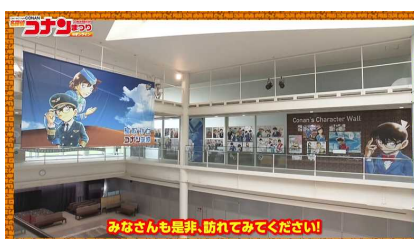
コナンスポットの紹介