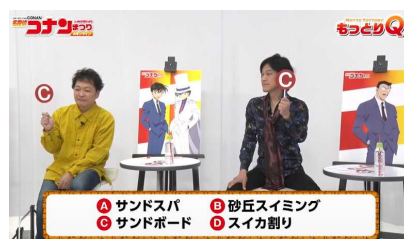
鳥取の観光スポットクイズ