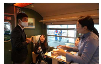
国際交流員によるJR「あめつち」取材

10月26日、11月2日、11月16日に県国際交流員がJR観光列車「あめつち」及び若桜鉄道観光列車「若桜号」ほかに乗車し取材した。現在、県公式SNS等を通じて、香港、韓国、台湾、欧米市場など多言語翻訳して随時情報発信中。