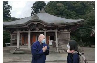
大山寺住職とのライブ配信の様子