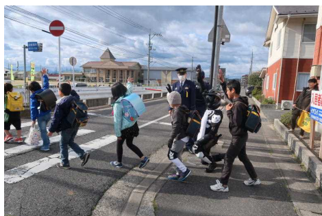
【横断歩道ストップキャンペーン】