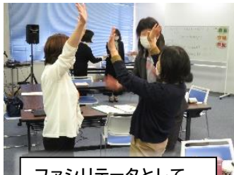
ファシリテータとして アイスブレイク②を担当