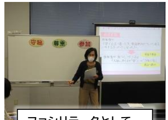
ファシリテータとして ワークショップを担当