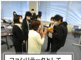
ファシリテータとして アイスブレイク①を担当

10月19日(火)に、伯耆しあわせの郷で第1回が開催されました。ファシリテータ同士の交流やプログラムの演習を行うことでスキルアップを目指します。今後のみなさんの活躍に期待しています。