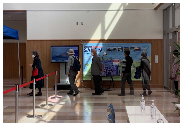
サーモグラフィカメラによる乗船客の検温