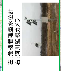
左：危機管理型水位計 右：河川監視カメラ