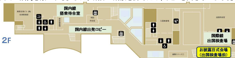
図 お披露目会場位置（鳥取砂丘コナン空港 国際線ターミナル2F）