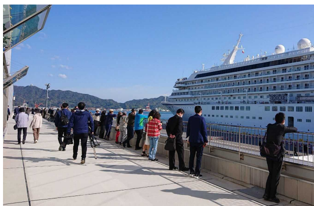
一般客は人数制限し展望デッキから見学