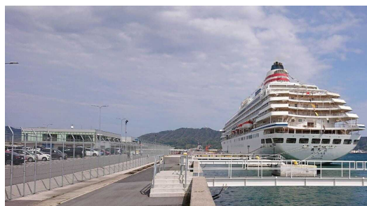
境夢みなとターミナルへの初寄港