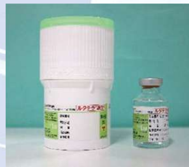
体内注入する医薬品「ルタテラ」

ルタテラ内用療法は、膵、消化管、肺等の全身の様々な部位に発生する神経内分泌細胞に由来する腫瘍である「ソマトスタチン受容体陽性の神経内分泌腫瘍」が適応となります。現在すでに第1例目の患者さんの治療が行われていますが、腫瘍マーカーは第1回目の投与後に正常化しており、治療の効果が現れています。