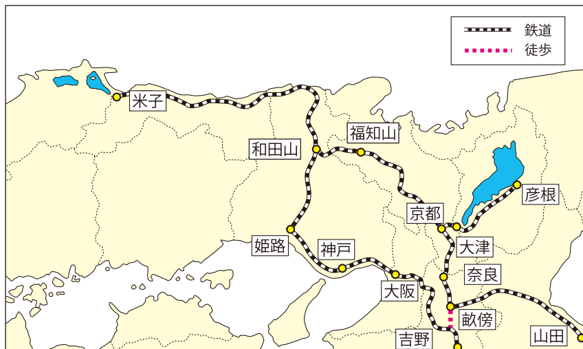
1912(明治45)年の米子中学の修学旅行の行程★