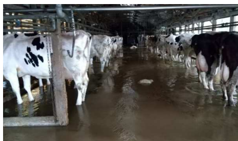
牛舎浸水被害 (琴浦町)