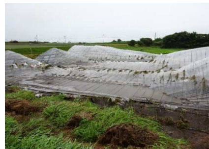
ハウス被害 (北栄町大谷)