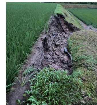
農地法面崩壊 (鳥取市鹿野)