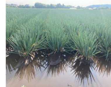
白ネギほ場の冠水 (境港市)