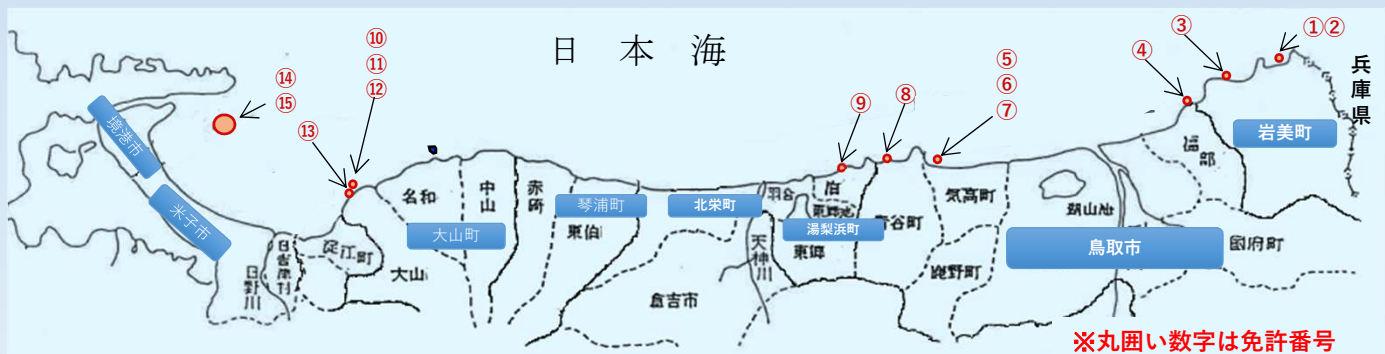
※丸囲い数字は免許番号