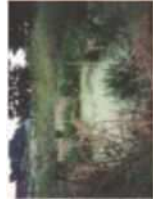
砂丘地に作られた浜戸戸

北条砂丘は弥生時代から遺跡が見つかっているものの不毛の状態が長く続き、江戸後期から厳しい環境に立ち向かった人々の砂丘開発の歴史が始まる。先進的な技術による開発で現在では豊かな農地となり、ぶどう・らっきょう・ながいも（ねばりっこ）などの産地になっている。ワイン醸造も行われ、北栄町らしい食文化も継承される地域である。