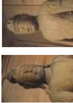
国指定重要文化財 東高尾観音寺仏像