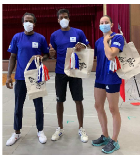
スタッフ T シャツと記念品