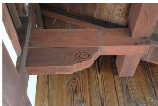
屋根を支える腕木