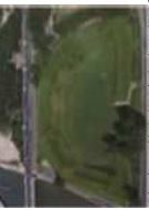
国史跡 鳥取藩台場跡(由良台場跡)

藩倉の新設により賑わいを見せた由良川流域を幕末、欧米の外圧から守るため、西洋の技術と伝統工法を融合した技術を駆使し、武信家を中心となり六尾反射炉と由良台場を建造。由良台場は当時のままの姿を残しており全国に誇れる近代化遺産となっている。また、由良宿には、往時の面影を残す町並や由良だんじりが今も受け継がれている。