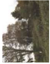
土下236号墳 (北条大野塚古墳)