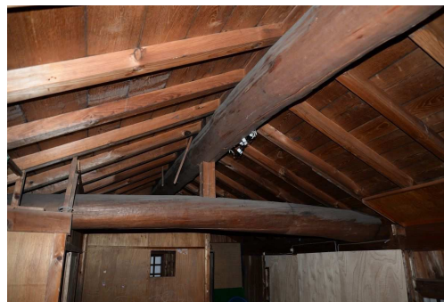
西蔵小屋裏見上げ