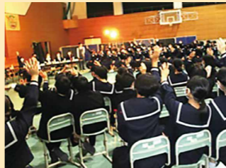
地域の方との白熱大討論会(北栄町立大栄中学校)