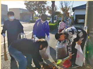
ケヤキ通り清掃(境港市立第三中学校)