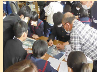
危険地域の確認作業(日野町立日野中学校)