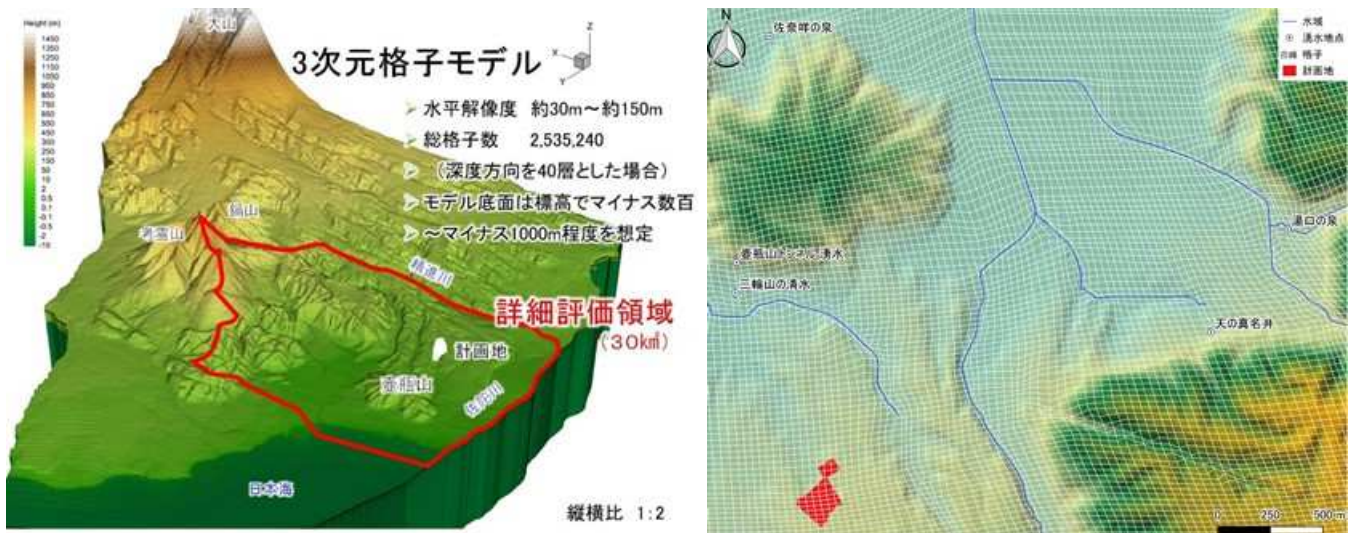
図2 三次元格子モデル(左:全域、右:拡大図)