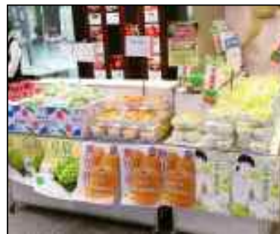
【食のみやこ鳥取県フェア】