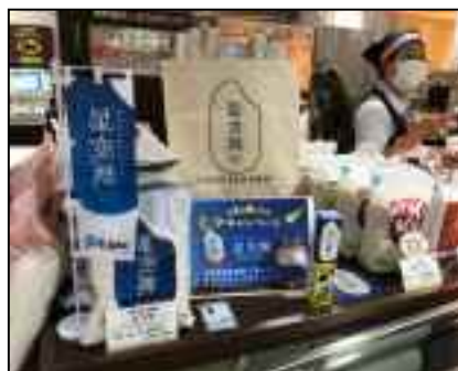
【星空舞七夕販売キャンペーン】