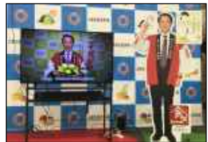
【知事ビデオメッセージ】