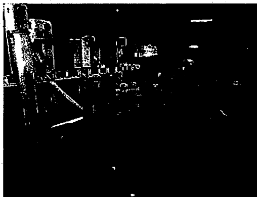
乾燥・籾摺り作業場