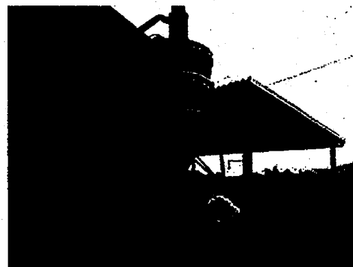
籾殻タンクからの排出作業