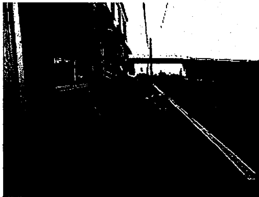
J R 沿線の作業場