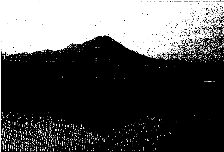
伯耆の郷水田から見る瑞風