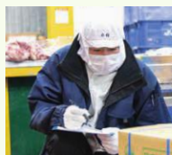
▲肉質の厳しいチェック

見極めるぞ！ 商品販売店やお客様に届ける出荷業務が私の仕事です。いまは豚肉を扱っており、枝肉を見て肉質の善し悪しを見極めるなど、目利きも必要。以前から豚に興味があったので、楽しく学んでいます。今後は牛肉の知識も深め、加工品の勉強もしたいと思います。