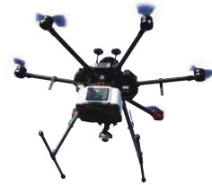
▲UAV(無人航空機)。上空からグリーンレーザーを発し、陸上、水中の3次元データを同時に取得できる。

2年ほど前に地元の男性と結婚し、昨年、新しい命を宿しました。土木事業は男性が多いと思われがちですが、当社は3分の1が女性職員。子育て中の先輩も多く、現在も1人が育児中なので、産休・育休の取得に不安はありません。