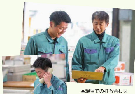
▲電話での営業活動も

出社は早いですが、果実部は午後2時半に終業なので、退勤後に自分の時間を多く取れます。週真ん中の水曜日に休みがあるので、疲れがたまりにくく自分に合っています。