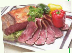
▲特製スパイスで仕上げた 贅沢なローストビーフ

若手社員が多く、お互い相談し合いながらわきあいあいと仕事をしています。何といっても、肉質日本一に輝いたブランド牛や県産ブランド豚を取り扱っているのが私たちの誇り。加工品はどれも好評で、私はローストビーフが特に好きです！