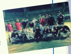
▲草野球の仲間たち

高校まで野球一筋。いまでも試合を見たり情報収集して元気をもらっています。時には、草野球にバッテリーとして参加。最新の打法理論を試しています。