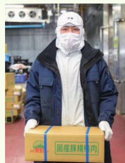
▲こだわりのお肉をお届けします