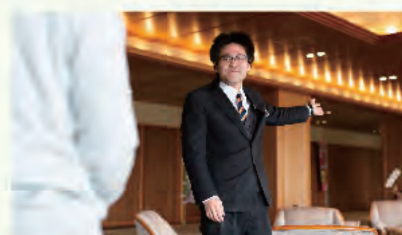
▲お客様に合わせたおもてなし