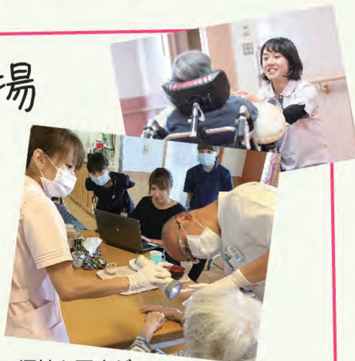
▲福祉と医療が連携した質の高いサービスを

認知症の方の介護をしています。チーム制で、リーダーが全体をよく見て引っ張ってくださるし、担当する利用者については私なりの方針を尊重してもらえます。休みも取りやすく、とても雰囲気が良い職場です。