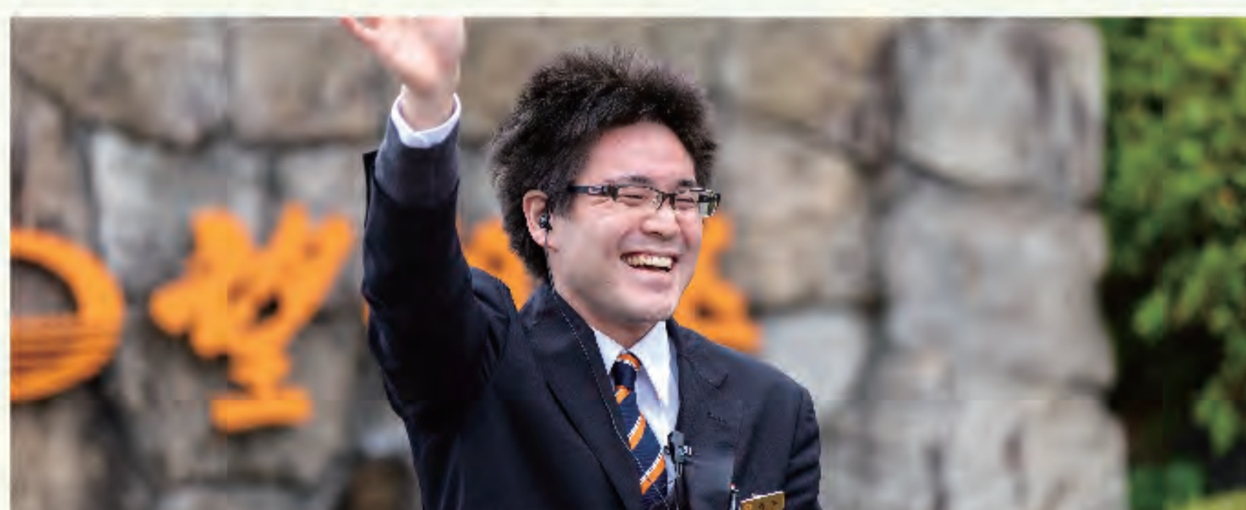
▲気持ちよく帰っていただけるよう最後のお見送りも大事な仕事

などのお手伝いをすることもあり、翌日の出発時に「宴会楽しかったよ」と言葉をいただけると嬉しいです。将来は、新年会などの企画を立て、企業に勧めに行く営業職にも挑戦してみたいです。