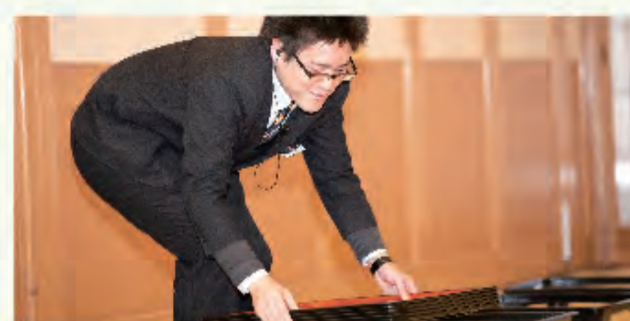
▲お客さまが楽しみにされている宴会の準備