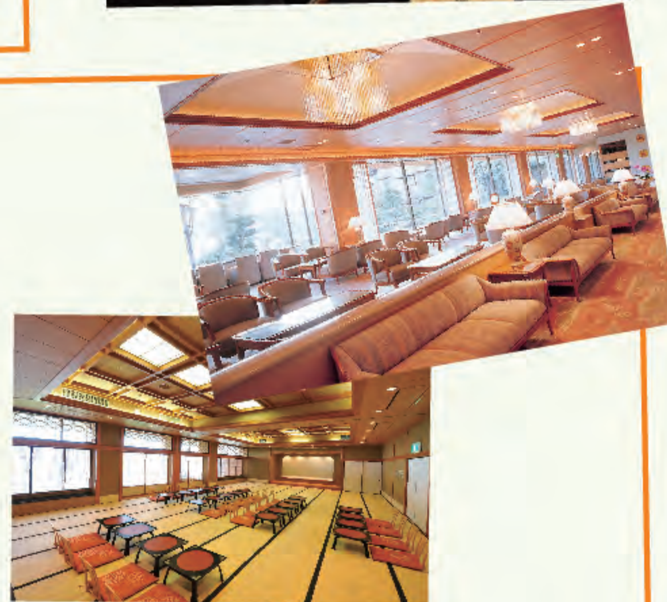
▲お客様を迎える空間が私の職場 毎日気が引き締まります

従業員は年齢も性別も様々で、公私ともにどんな話題でも相談相手があります。60歳代の男性の先輩に「父の日にもらって嬉しい物は？」と聞き、参考にしたこと。町で知らないお店の看板を見つけたら、地元出身の同僚に詳しく教えてもらいます。