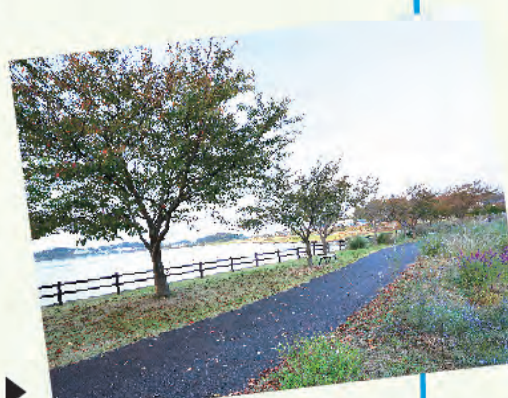
湖山池と周辺の道▶

ロードバイクとオートバイが趣味で、休日に友人たちと出かけます。鳥取は湖山池周辺がお気に入り。妻と1歳の娘も仕事のゆみです!