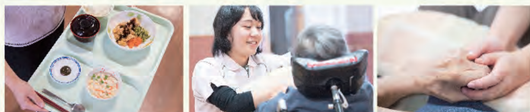
▲食事のサポートや日々のコミュニケーションで心を通わせる