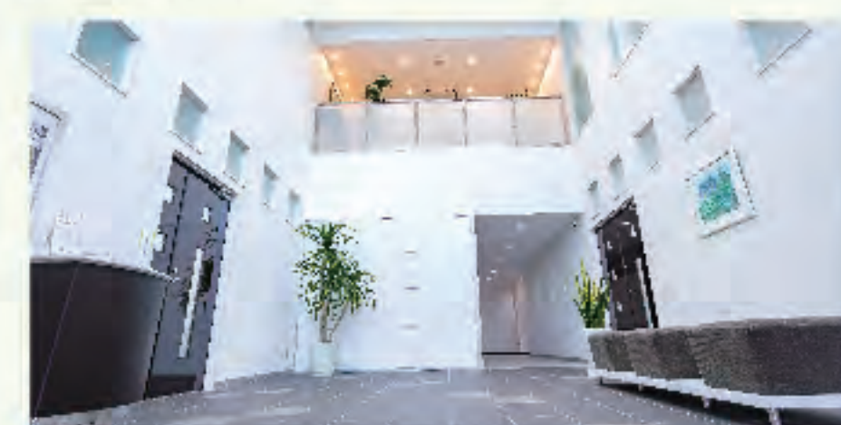
▲清潔感と開放感溢れる社内