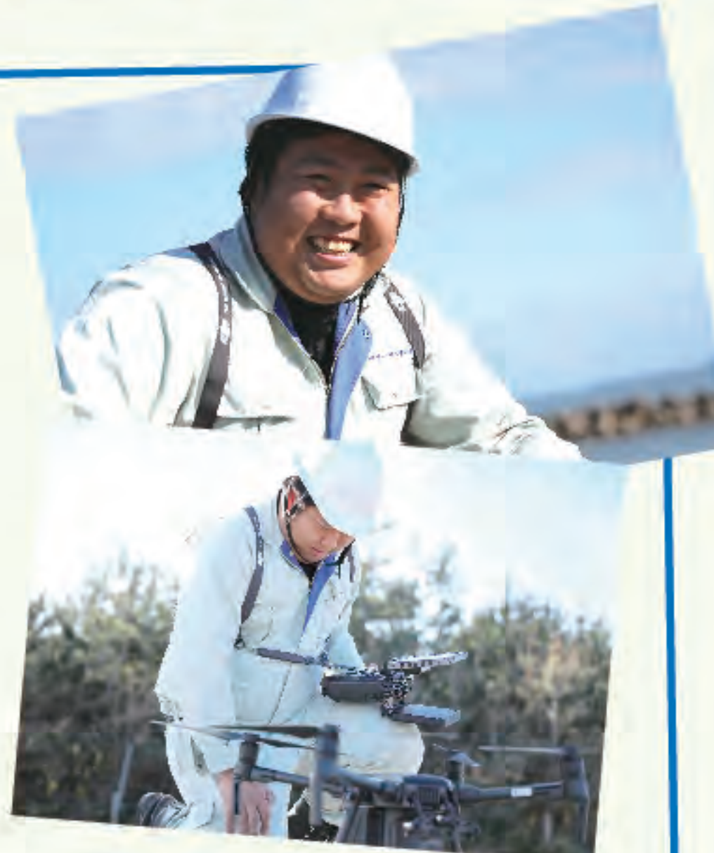
▲仕事を任される喜び

多くの方が利用するものを作ることにやりがいを感じます。2016年12月に本社が建て替えられているので、職場がきれいで、面接で見てびっくりしました。モチベーション高く、きもちよく働いています。海岸清掃などの社内活動で、同年代の社員と部署を越えて相談しあい、刺激をもらっています。