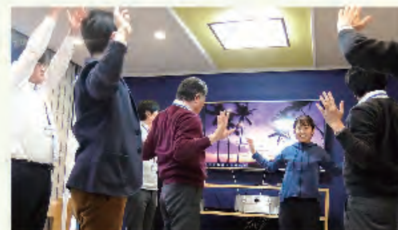
▲ラジオ体操で気分転換