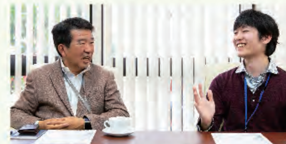
▲社長とも話しやすい環境