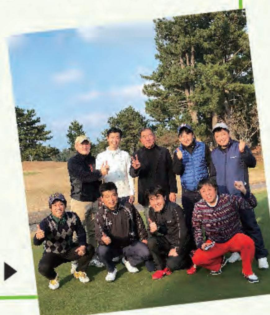
職場の人たちとのゴルフ▶

先輩に誘われサーフィンを始めたりと入社後に趣味が増えました。休日は上司とゴルフに行き、楽しく充実した毎日を送っています。