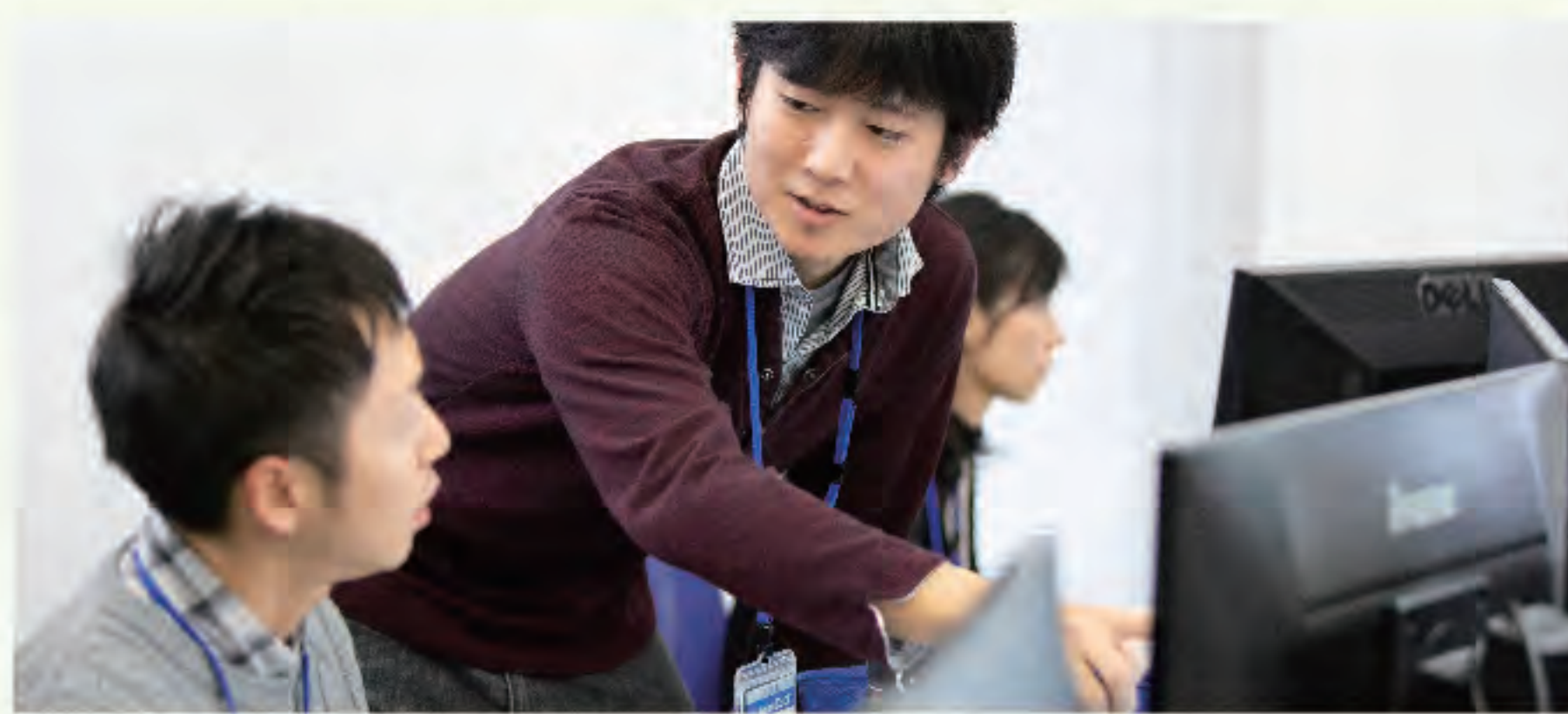
▲エンジニアチームの密なコミュニケーションで業務遂行

ふるさと鳥取県定住機構のHPで偶然見つけた会社でした。そこで「いいな」と思った「ふるさと納税システム」を、今では実際に改良し、新機能を追加しています。人工知能(AI)を活用したビジネスに興味があるので、そのアイデアが出せるようになりたいですね。