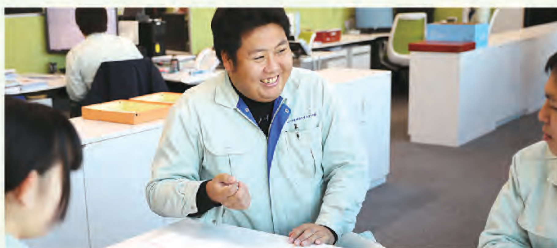
▲部署を越えて行う綿密な打ち合わせ

これまでの手法から最新技術まで、測量の基礎を勉強しています。経験豊かな先輩方を見習い、もっと技術力を高めたいです。現場で出会う地域の方は、みなさん気さくに話していただき、濃く触れあえるのが楽しいですね。快適な社内空間でのコミュニケーションも楽しみのひとつ。