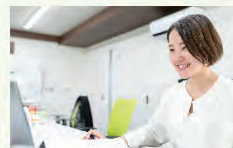
▲笑顔がこぼれる相談者様との電話 ▲快適な職場環境