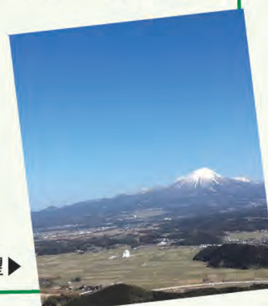
母塚山(南部町)から一望▶

休日は地元に詳しい主人に、絶景ドライブに連れてってもらい、地元の魅力を日々再発見しています。趣味は旅行。目指すは全国制覇。