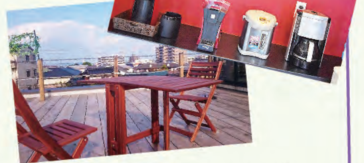
▲バーカウンターを備えた休憩室やウッドデッキの屋上など快適な仕事環境が整っています

全国に通用する仕事に関わることができることにかっこよさを感じました。私服勤務なのでリラックスして働くことができます。休憩室には野菜ジュースなど無料のドリンクが多数あり、いつもリフレッシュしています。