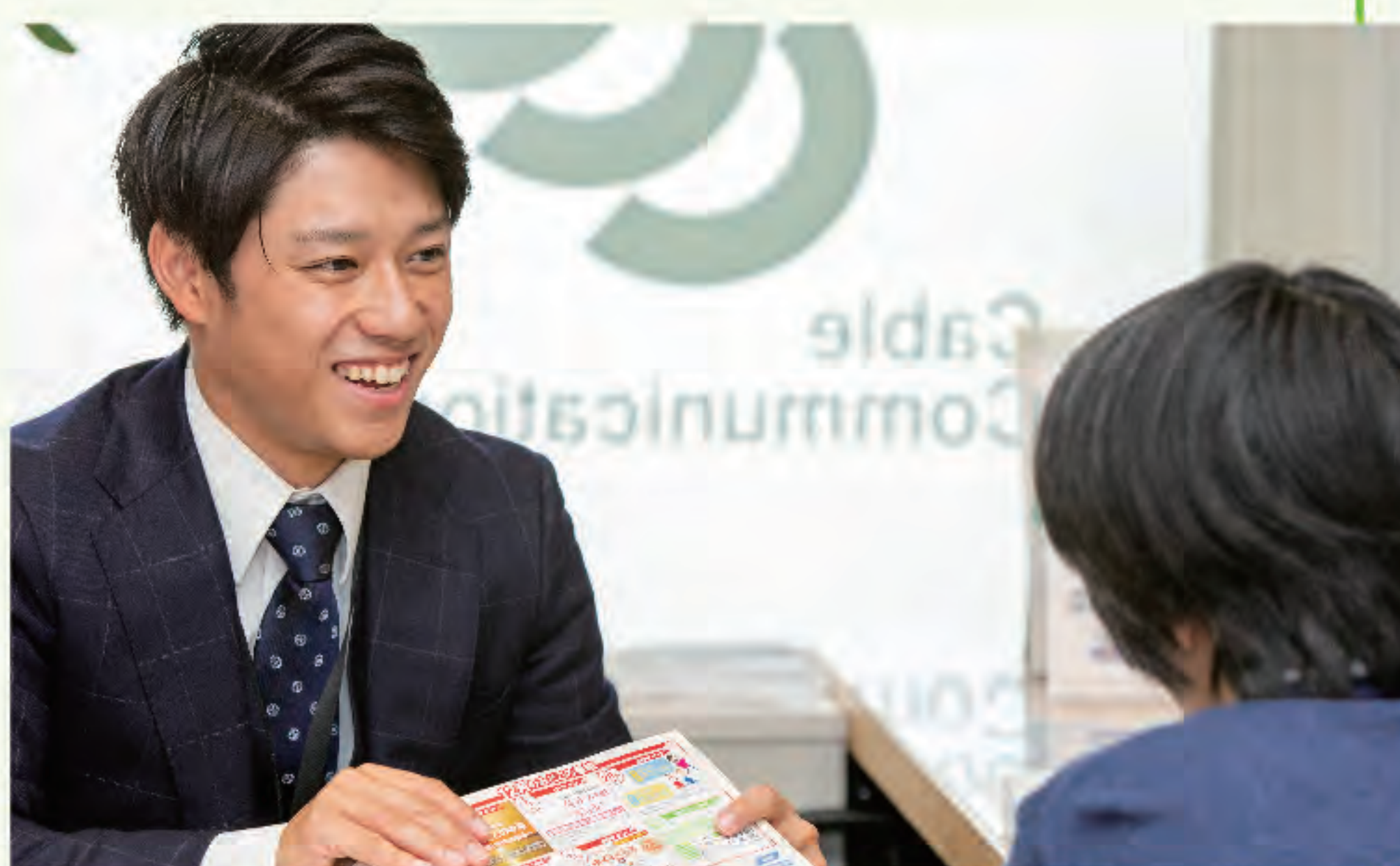
▲視聴者の方の声が直接聞けるやりがいある現場

営業職は、視聴者を自ら獲得できる仕事。「どんな番組を見たいですか」と直接話し、中海テレビ放送の提供するこの会社に