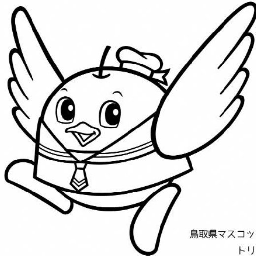
鳥取県マスコットキャラクター トリピー

☆この入居には、申込資格がありますので、この「入居者募集案内」をよく読んでから、申し込みをしてください。