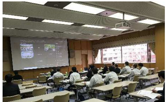
【第6回検討会の様子】