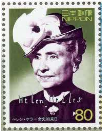
ヘレン・ケラー（1880.6～1968.6） 盲ろう者で大学教育を 修めた世界最初の人