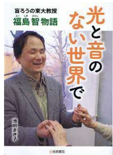
福島智（1962.12～） 盲ろう者で大学教授に なった日本最初の人