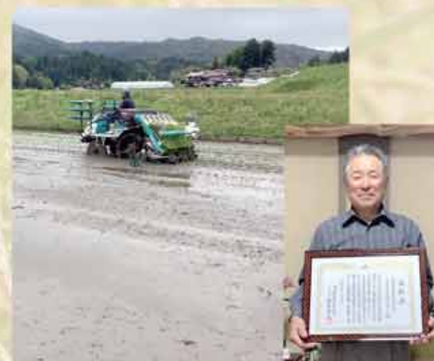
星空舞の田植風景

日南町の米生産者による受賞は2年連続で、日野郡のお米の食味、品質の良さが実証されました。