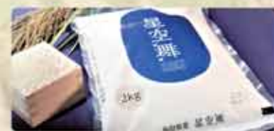
星空舞パッケージ