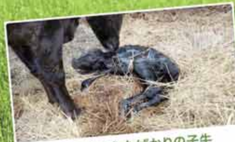
農家で生まれたばかりの子牛 この子牛を約9カ月育てて和子牛セリに出荷します。