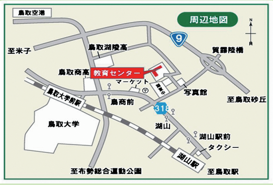
鳥取県教育センター案内図

もうしこみ うらめん しめきり がつ にち きん 申込は裏面へ 〆切：12月9日(金) たいけんじゅぎょう けんがく どうじつさんか ※体験授業の見学の当日参加ができます。 たいけんじゅぎょうかい そうだんかい さんか かた ☆体験授業会や相談会に参加したい方は もうこ ひつよう あらかじめ申し込みが必要です。 とくべつ りゆう じゅぎょうさんかん きぼう かた そうだん ☆特別な理由で授業参観を希望される方、ご相談、 しつもん かた とあさき れんらく ご質問のある方は【問い合わせ先】までご連絡ください。