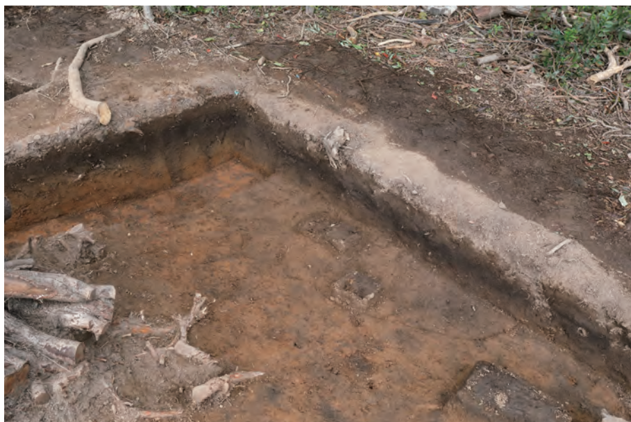
2 3404 遺構検出状況 南西から