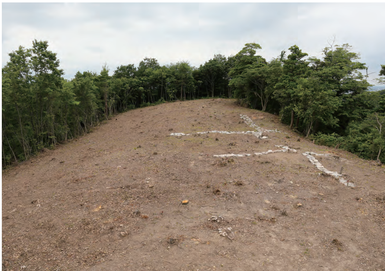
1 松尾頭 10 区南西部 調査前状況 東から