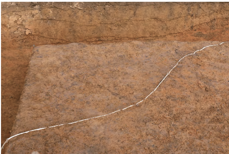
3 3406 遺構 確認用サブトレンチ 北側土層断面 (B - B') 南西から