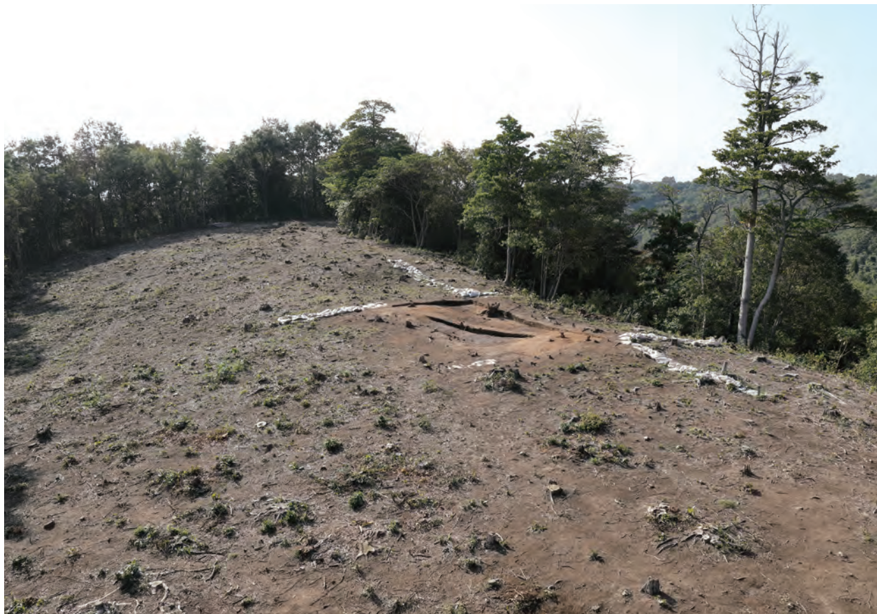
2 松尾頭 10 区南西部 調査終了状況 東から