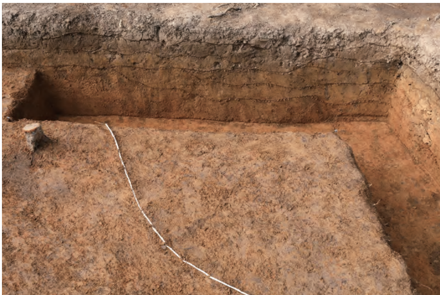
2 3406 遺構 確認用サブトレンチ 西側土層断面 (A - A') 南東から