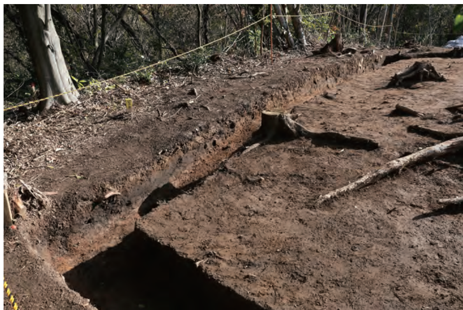
2 基本層序断面 A'' - A''' 南東から