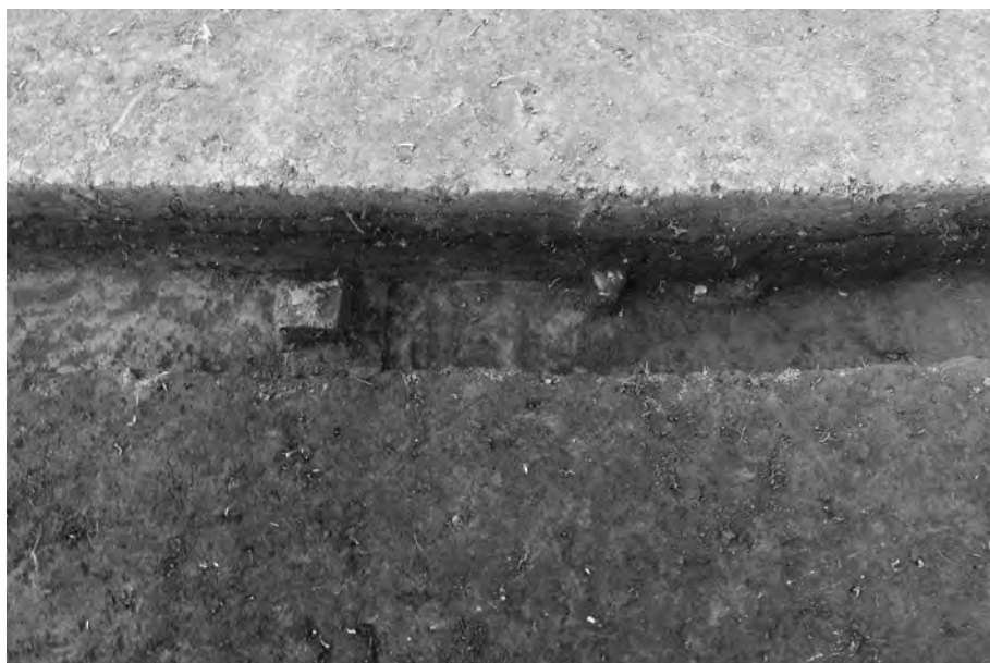
2 松尾頭4号墓 周構内遺物出土状況 北東から