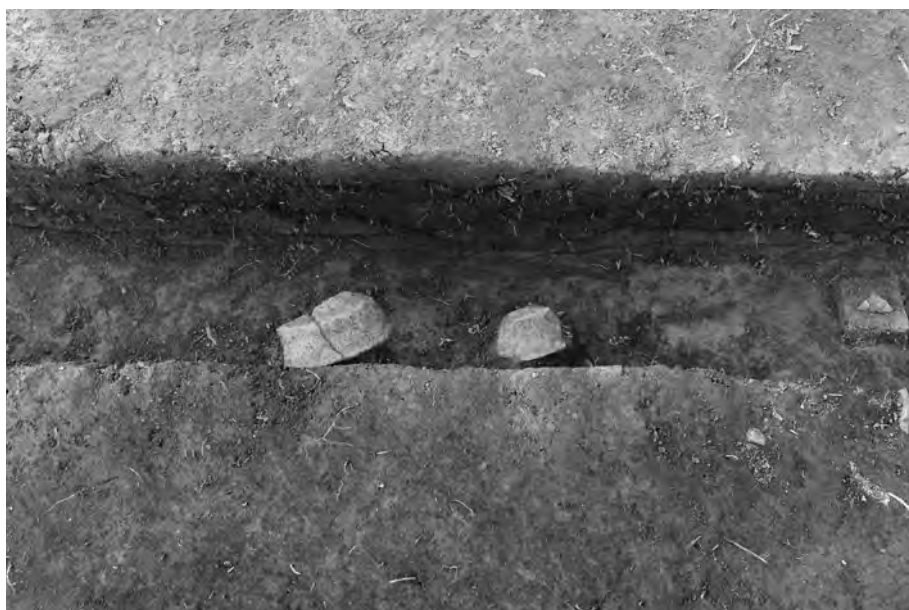
3 松尾頭5号墓 周構内遺物出土状況 北東から