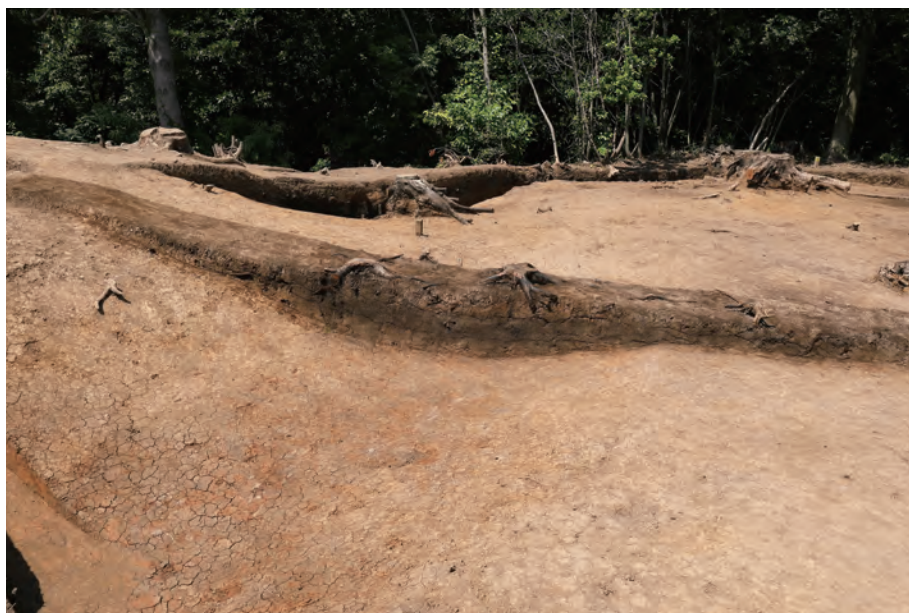
1 基本層序断面 B - B' 南から