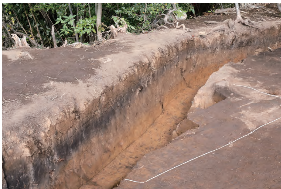
3 3407 遺構土層断面 南西から