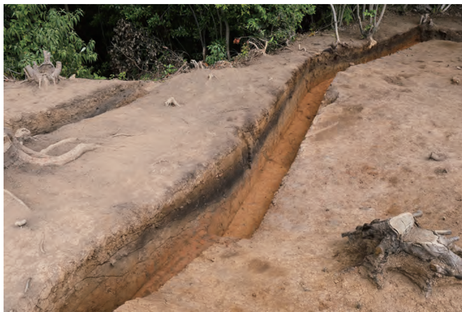
1 基本層序断面 A - A' 南西から