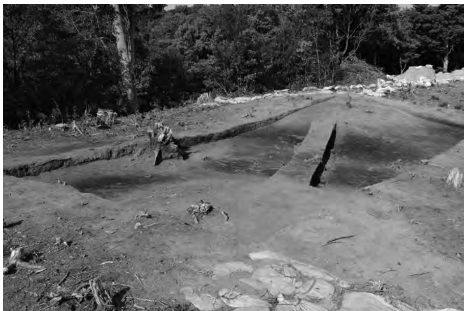
1 周溝及び墳丘検出状況 南から