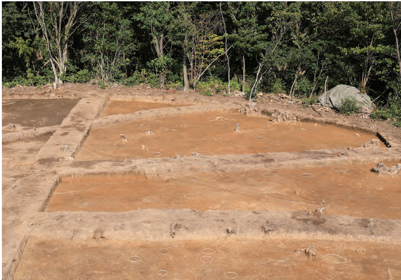
2 松尾頭 10 区北東部 調査区東側調査終了（遺構検出）状況 南東から