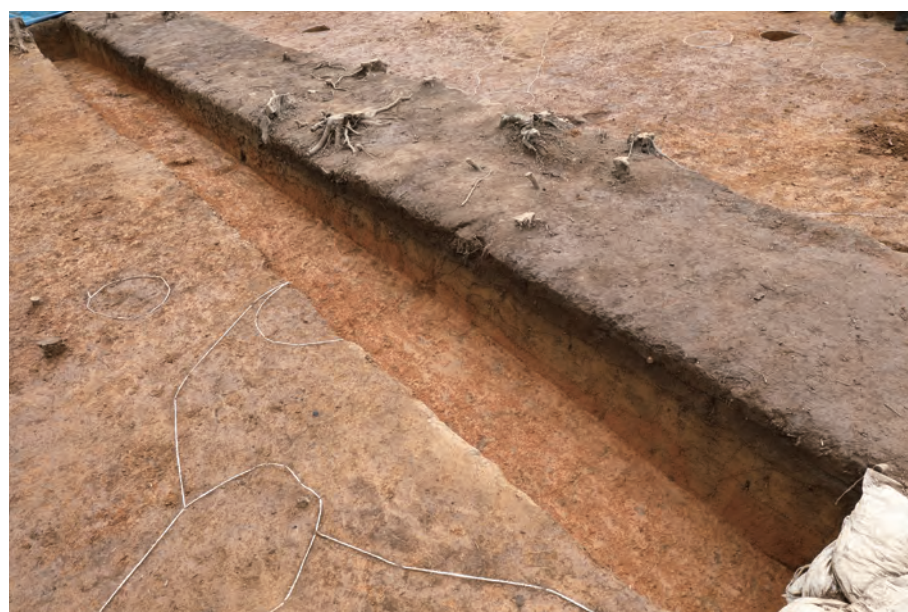
3 基本層序断面 C' - C'' 東から