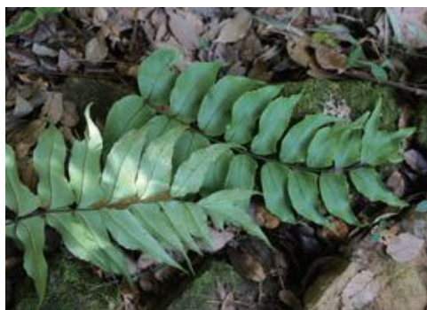
鳥取市福部町 2021.12.14

■ 選定理由 ：県内では自生地が少なく、個体数も少ない。空中湿度の低下に弱く、森林伐採や河川改修にともなって減少している。