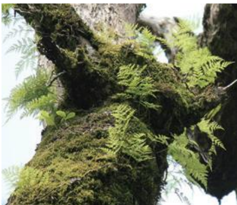
智頭町 2021.6.1

■ 選定理由 ：県内各地に点在するが，観賞用のシノブ玉をつくる目的などで常に採取圧がかかっており，注意が必要である。