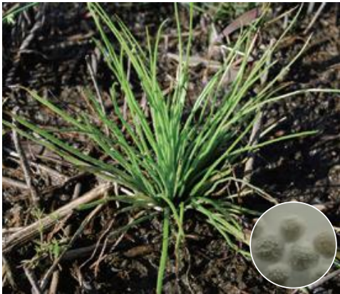
円内は大胞子。 大山町 2021.9.24

■ 選定理由 ：県内では2017年に発見され、生育地は2カ所に限られる。個体数もごくわずかである。生育地の管理方法によっては絶滅の危険性がきわめて高い。