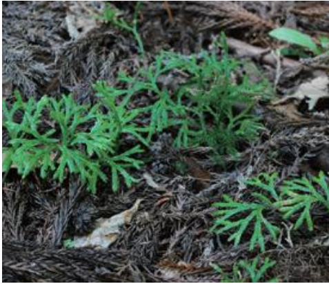
兵庫県宍粟市 2021.6.10

■ 選定理由 ：日野郡生物誌では1950年代には「日野郡の海拔1000m以上の高所に必ずあり」とされていた。その後1980年代前半まで朝鍋鷲ヶ山(1074m)の山頂部で生育が確認されていたが、周辺の開発による環境変化で絶滅した。その後は県内では発見されていない。