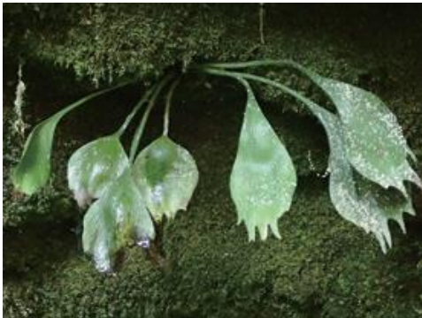
鳥取県内 2019.4.3

■ 選定理由 ：全国的にも希少な種で園芸用採取圧が強い。県内では種の存続に支障をきたすほど個体数が著しく少ない。生育環境の変化による絶滅の危険性も大きい。