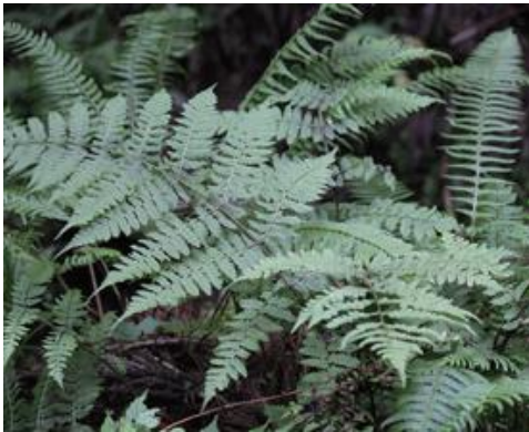
智頭町 2013.7.1

■ 選定理由 ：県内東部のスギ植林地，谷沿いの広葉樹林下に生育する。シカの食害により壊滅状態となった生育地もあり，絶滅が危惧される。