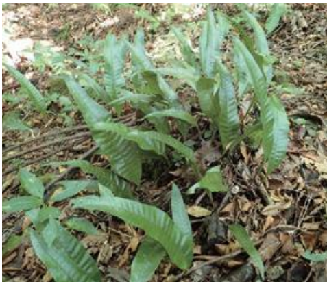
鳥取市福部町 2021.9.20

■ 選定理由 ：県内の自生地は限られる。健全に生育している場所は多いが、過去には消滅した場所もある。