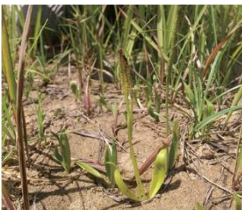
鳥取砂丘 2021.7.30

■ 選定理由 ：県内では湿った砂地や湿地にまれに自生するのみで個体数も少ない。草原化により生育地が減少するおそれがある。