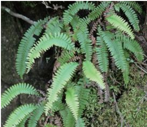
智頭町 2012.5

■ 選定理由 ：県内の自生地は少ない。現状は維持されているものの園芸目的で採取されることがあり、注意が必要である。