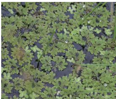
鳥取市 2006.7.7

■ 選定理由 ：50年ほど前には、八頭町内などで本種が繁茂し水田が赤くなる現象が見られた。その後の水田環境変化により県内での確認地はなくなった。2004年に鳥取市水尻池西側の水田に集団が見つかり鈴木武博士により在来の但馬型と同定された。冬季は周囲からかん養される用水路内で生育し夏季の湛水中は水田の取り入れ口付近に繁茂が見られたが、2007年以降当該水田は休耕となりそれ以降毎年の調査で見つからないため、絶滅と判定されている。