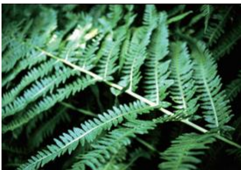
若桜町 1990年代

■ 選定理由 ：若桜町内のブナ林下にて見つかったが，2000年代に入ってから確実な発見例なし。現地の下層植生はシカ食害が多く本種の現状は不明。