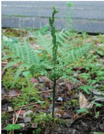
日野町 2021.7.6

■ 選定理由 ：県内では、若桜町内で1988年に生育が記録されたが、その後は2009年の調査を含め確認ができていない。県内東部ではシカ食害が激しく現状が心配される。2021年に日野町内で新たに数個体の生育が確認された。