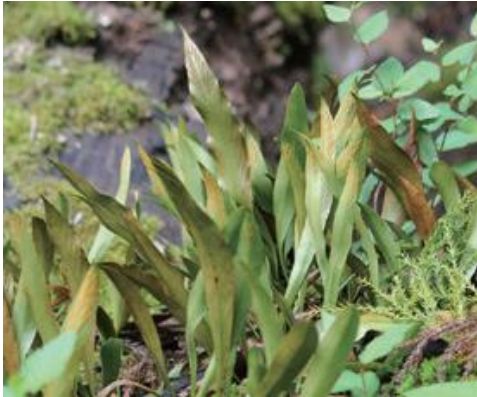
智頭町 2017.9.9

■ 選定理由 ：県内では深山の樹幹および岩上に着生するが、自生地は限られ個体数も少ない。ナラ枯れ等により着生に適した古木が減少している。園芸目的の採取も多い。