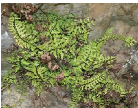
若桜町 2020.6.2

■ 選定理由 ：県内東部の古生層（三郡変成岩）地帯に生育し、自生地は限られる。園芸目的で採取されることがある。