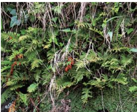
湯梨浜町 2021.9.11

鳥取県：絶滅危惧 I 類 (CR+EN) 環境省：絶滅危惧 I B 類 (EN)