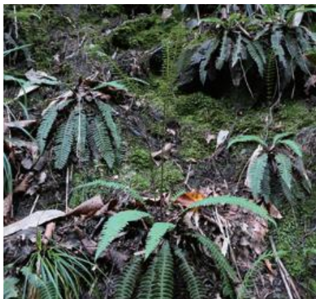
鳥取市河原町 2020.8.12

■ 選定理由 ：県内では生育地が少なく個体数も多くない。自然林の伐採や溪谷の荒廃等で生育立地が失われつつある。