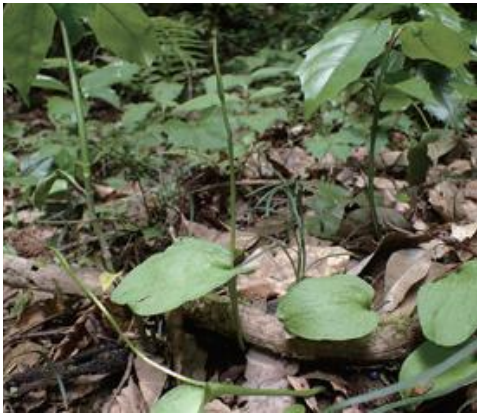
南部町 2021.5.8

■ 選定理由 ：近年、西部で1カ所自生が確認された。自生地は広葉樹林の林床で環境変化の懸念は少ないが、県内では他に生育が確認されていない。