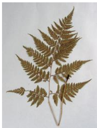
標本 若桜町 2001.10.4 採集

■ 選定理由 ：県内東部の山地常緑広葉樹林下に生育するが、谷間の自然林破壊によって減少していた。近年はシカの食害がひどくなり見つからなくなっている。