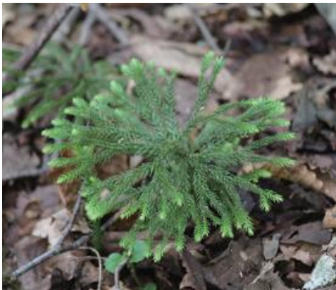
智頭町 2021.7.1

■ 選定理由 ：県内では大山、氷ノ山、東山などの高海拔地に生育する。県内東部ではシカ食害により植生が貧弱化しており、生育環境の悪化が危惧される。園芸用採取のおそれもある。