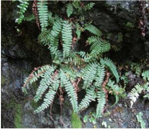
鳥取市佐治町 2019.8.24

■ 選定理由 ：個体群は小規模で離散的である。若桜町，鳥取市佐治町，日南町で確認されているが個体数は少ない。個体数も減少気味である。