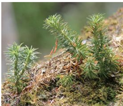
智頭町 2020.6.1

■ 選定理由 ：着生に適した古木がナラ枯れや台風被害などによって減少傾向にある。さらに倒伏した古木からの採取や着生環境の激変により個体数の減少が危惧される。