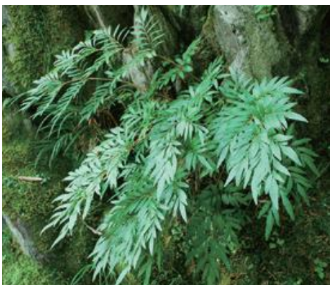
日南町 2021.8.5

■ 選定理由 ：ダム建設と園芸用採取のため減少し、初版では野生絶滅とされていたが、その後生育が再確認された。県内の生育地は日野川流域の一部に限られ生育個体数もきわめて少ないため、絶滅のおそれが大きい。