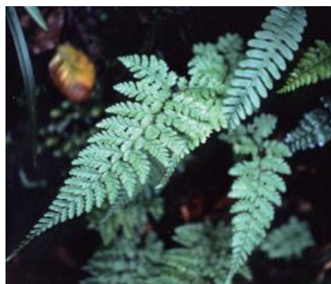
高鉢山 1990年代

■ 選定理由 ：県内で確認された自生地は高鉢山に限られ個体数も極めて少ない。初版時に，自然林の荒廃にともない株数が減少していると報告されているが，2000年代以降の確認はできていない。