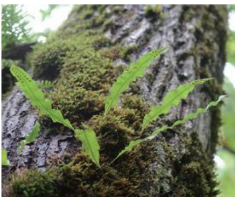
八頭町 2018.9.4 / 撮影：前田雄一

■ 選定理由 ：深山の樹木および岩上に着生するが、自生地は限られ、個体数は少ない。近年ナラ枯れ等により、着生に適した古木が減少しており、本種も希少化している。