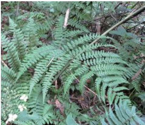
兵庫県内 2014.9.22

■ 選定理由 ：県内では高鉢山の渓谷沿いで確認されたものが唯一の記録。近年の生育確認はできておらず現状不明。