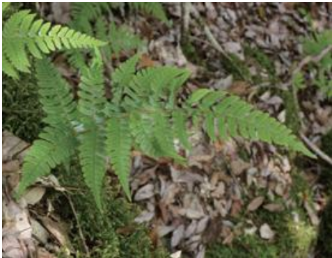
若桜町 2019.6.1 / 撮影：坂田成孝

■ 選定理由 ：若桜町山地の岩場に生育するが、生育地が限定的である。林床ではシカの食害により消滅、岩上のみ生育。