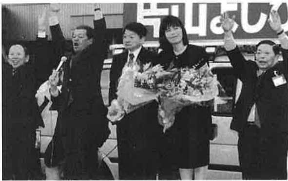
中央が喜びの片山知事

私なんかのようにできない悪たい。私の勤務先は千代田区。西は台地の尾根続きだけに当