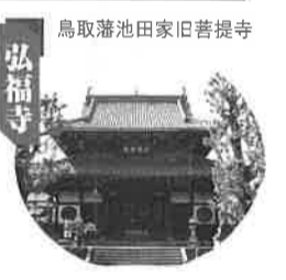
鳥取藩池田家旧菩提寺

江戸の風にながれながら見 所いづばいの本郷、上野公園、 浅草、両国界隈の散策にぜひ 参加ください。 都営大江戸線、本郷三丁目 駅をスタートし、鳥取藩ゆか りの上野黒門、鳥取藩池田家 旧江戸上屋敷表門、弘福寺 (池田家旧菩提寺)などをめ ぐり両国駅をゴールとする ウォークです。約10km、所要 時間約3時間。 実施日 平成15年6月7日(土) 集合場所 都営大江戸線 本郷三丁目駅改札口前