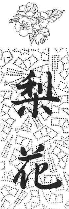
題字 / 西尾 邑次 名誉会員揮毫

第15号 2003年5月30日発行 東京鳥取県人会事務局 〒102-0093 東京都千代田区平河町2-6-3