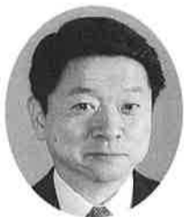
片山善博 鳥取県知事