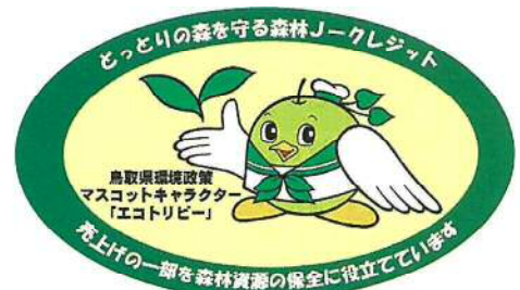
商品ラベルのイメージ