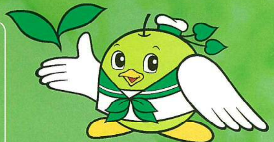
鳥取県環境政策キャラクター 「エコトリピー」