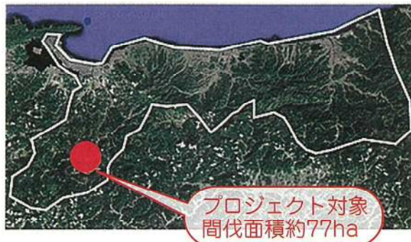
プロジェクト対象 間伐面積約77ha

鳥取県は、明治時代から土地所有者と分収契約を結び、森林整備に取り組んでおり、植林後も、保育・間伐などの管理を継続し、森林認証SGECを取得するなど、持続可能な森林づくりを進めています。