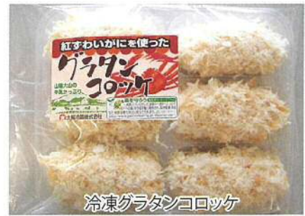
冷凍グラタンコロッケ