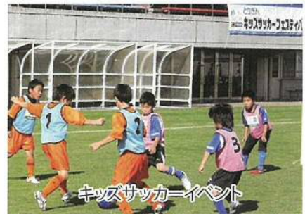
キッズサッカーイベント