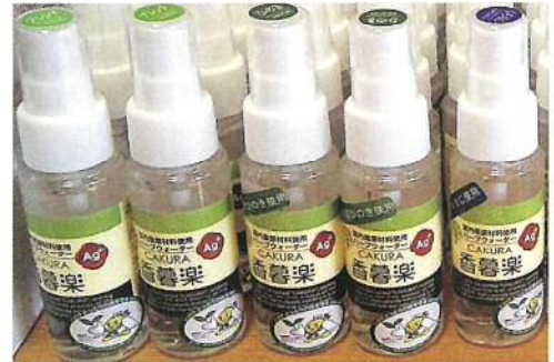
商品への使用例 赤松産業株式会社 消臭スプレー