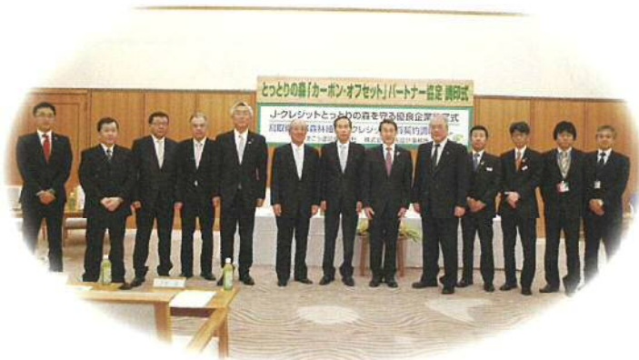
森林Jークレジットの購入をPR (やまこう建設株式会社とのパートナー協定調印・ 株式会社白兔設計事務所の優良企業認定)

皆さまのニーズに合った取組を御提案させていただきます。 あらゆる機会を取組をPRさせていただきます。