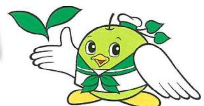
鳥取県環境政策キャラクター 「エコトリピー」