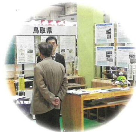
イベント等でカーボン・オフセットの取組をPR (エコプロダクツ 東京ビッグサイト)