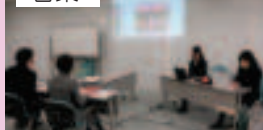
山内主幹教諭(桜ヶ丘中) 西垣教諭(八頭中)