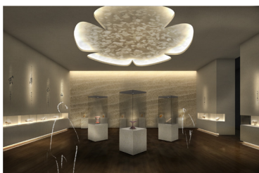
重要文化財展示室