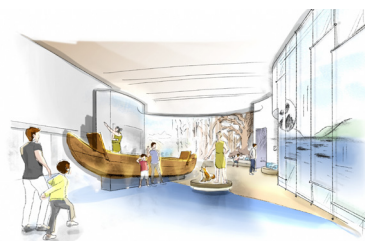
展示ガイダンス施設内の様子