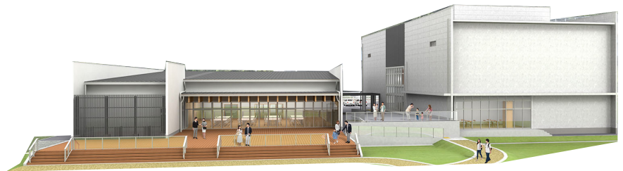
展示ガイダンス施設