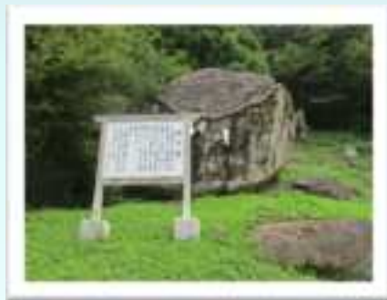
◀ 鳥取の「落ちない岩」といったらココ！この御子岩は鳥取大地震のときも不動だったと言います。