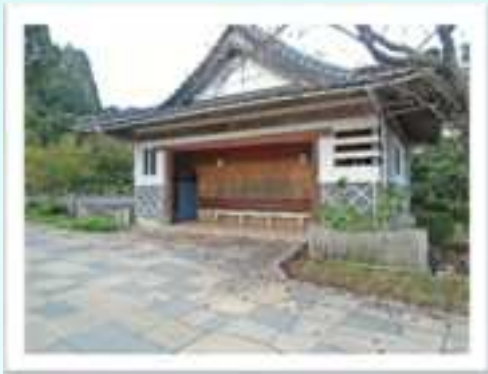
鹿野城跡公園トイレ。トイレはここにしかありません。