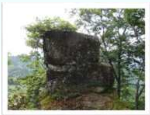
◀ 6合目付近（標高1,150m）には檜櫓（ひのきやぐら）の巨岩が立ちのびています。