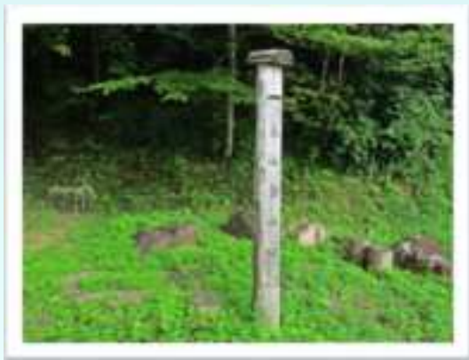
▲第一登山口駐車場です。 車は3台ほど停めることができます。