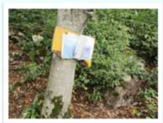
◀展望所の目印です。ここから背後を振り向くと、良い景色が！