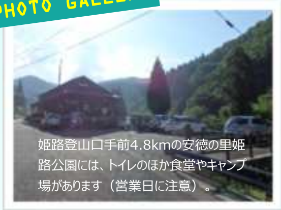
姫路登山口手前4.8kmの安徳の里姫路公園には、トイレのほか食堂やキャンプ場があります（営業日に注意）。