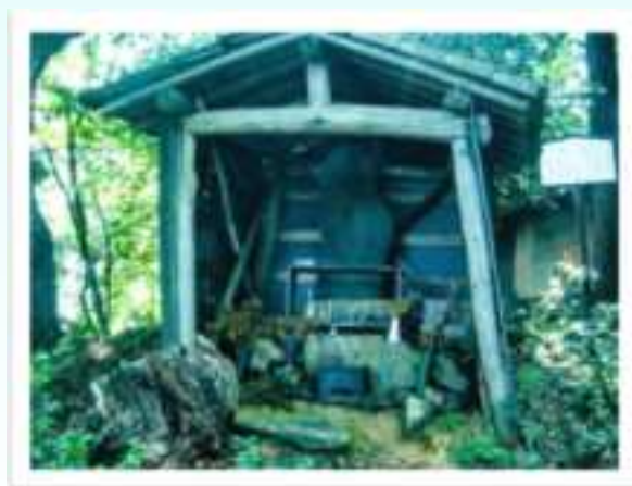
▲山頂には、丸瀬山霊場があります。