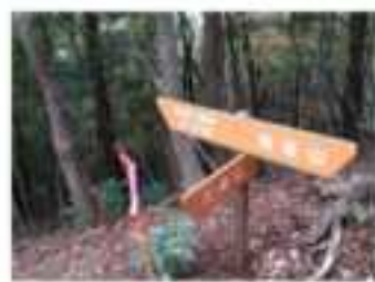
▲おう穴コースと用瀬アルプス縦走路の分岐点。赤波川渓谷には大小様々なおう穴があり、県の天然記念物に指定されています。