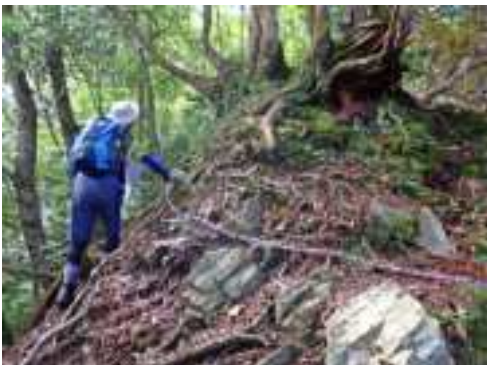
▲ 溪谷ルートと尾根ルートに分かれます。シャクナゲの群落がみられる尾根ルートは、巨木の根をクサリ伝いに登る急斜面があります。

植生 この山の植生は、 ブナ や ミズナラ などの落葉樹とスギなどの針葉樹が混在しており、標高1,000m付近の落葉樹は、秋に登山道を紅葉で彩ります。西仙コースの標高730m付近に シャクナゲ や イワカガミ の群落があり、4月中旬から下旬が見頃です。