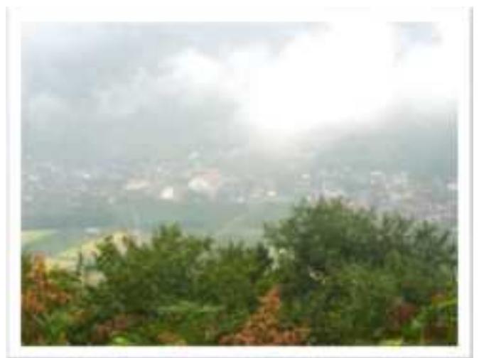
山頂からは大御門方面と若桜方面を見渡すことができます。