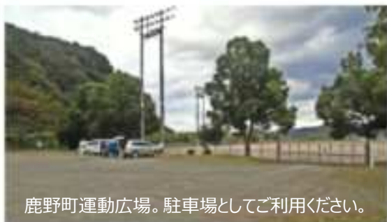
鹿野町運動広場。駐車場としてご利用ください。

ホットピア横のおもしろ市では、地元の野菜や加工品を購入することができます。是非お立ち寄りください。