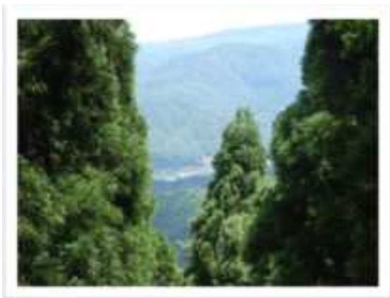
▲峠の杉木立のすき間から八頭町丹比地区方面を眺めることができます。

綾木峠につきましては、八頭町観光協会のホームページでも情報を掲載していますのでご覧ください。