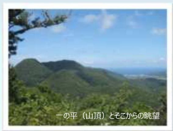
一の平（山頂）とそこからの眺望

◀広域農道を入ると左手に第一駐車場が見えてきます。水洗トイレ有。トイレはここで済ませましょう。