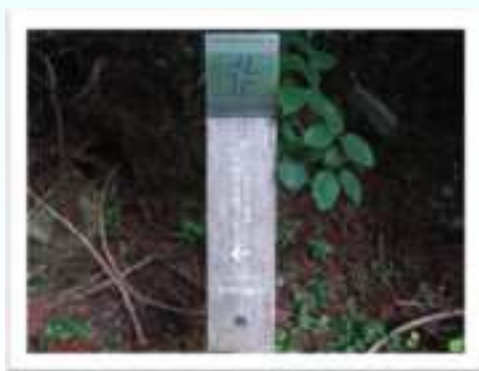
▶沖ノ山林道沖ノ山トンネルの手前が遊歩道入口です。