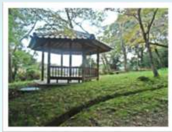
左手に六角堂があります。