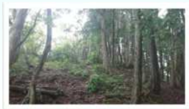
▲山頂付近は勾配があり、滑りやすい道となります。また、枯れ木の倒木にご注意ください。