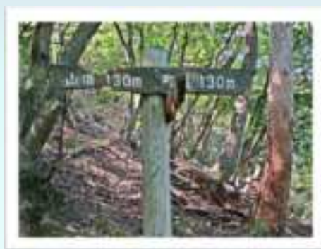
◀船岡竹林公園 コースと殿西谷線 コースの合流地 点です。看板に 従ってください。

▶休憩地点 に15分程度 で到着します。 軽く休憩をし ておくとよいで しょう。