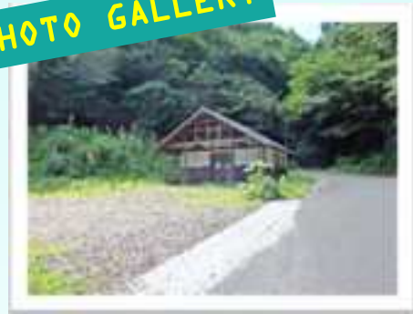
▲芦津溪谷駐車場に十分な駐車スペースとトイレがあります。遊歩道入口まで歩いて5分です。