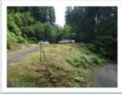
◀ 若桜弁財天の参道入り口に 駐車場とトイレがあります。