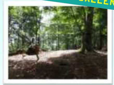
▶ ブナの原生林を弁天山 へ向かいます。尾根の縦走 路は比較的ゆったりですが、 弁天山手前は急峻です。