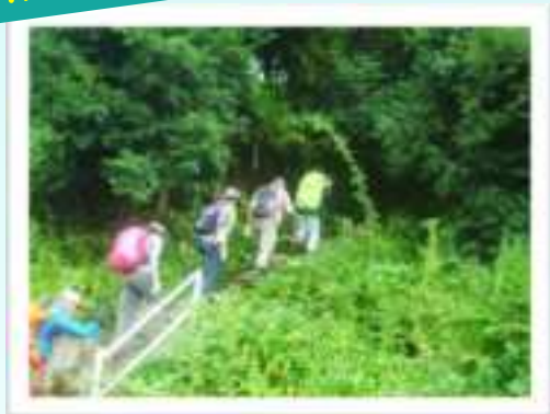
▲日下部神社の参道に入ります。

▶しばらく進むとお地蔵様がいっぱいあります。この付近に旧道との分岐がありますが、直進してください。