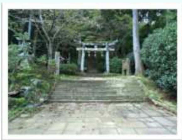
鳥居をくぐり登山路に入ります。