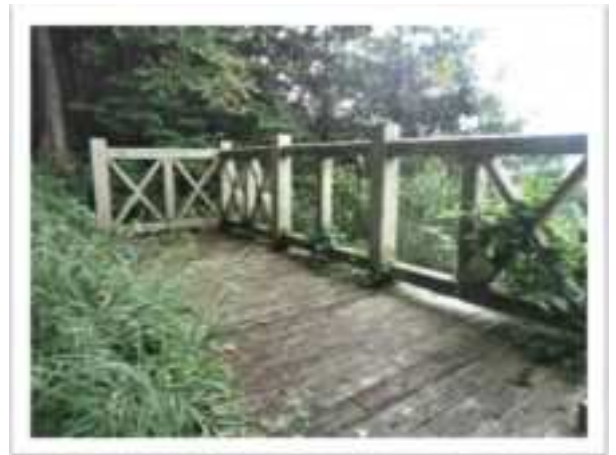
7合目を過ぎて、途中に展望台があります。隠岐の島が見えることもあります