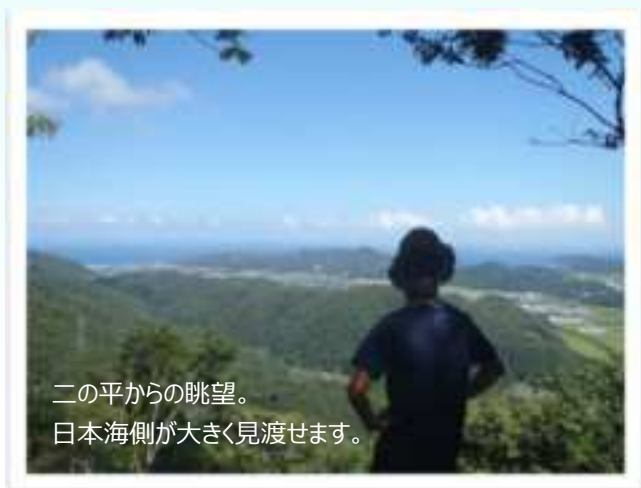
二の平からの眺望。 日本海側が大きく見渡せます。