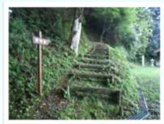
城山神社がゴールではありません。もう少し上まで登ってみてください。