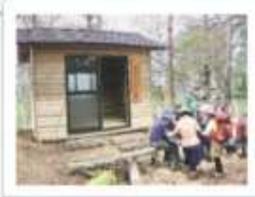
▼おおなる小屋。おおなる山の592mピークを過ぎたところに、避難小屋があります。