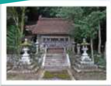
◀ 国英神社横に登山口があります。車は最勝寺参道入り口の駐車場へ止めてください。