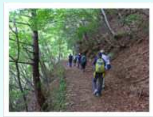
◀遊歩道は中国自然歩道として整備され、標高差も100mほどで、散策には最適です。