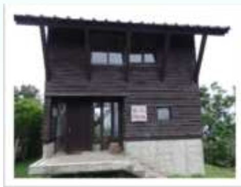
▼ 山頂には避難小屋があります。