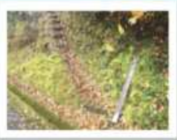
▲フォレストリア用瀬登山口。少しわかりにくいです。