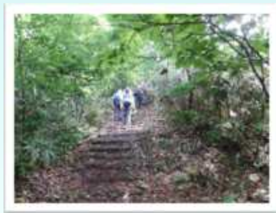
▲ 7合目付近の斜面を登り切れば山頂まではなだらかな尾根を歩きます。