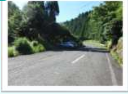
▲柿原集落入口の県道沿いには、数台駐車できるスペースがあります。