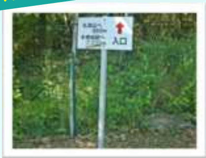
▲船岡竹林公園登山口から登ります。 登山届の提出とトイレは事前に行いましょう。