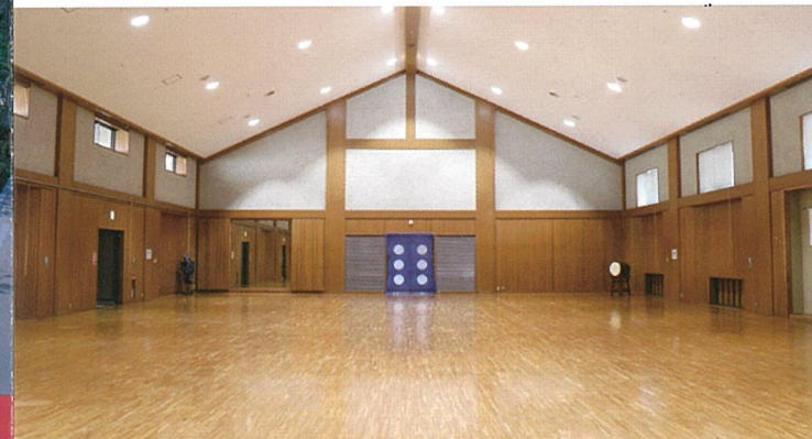
小道場(2)床面積540㎡(通常2面) ※288畳