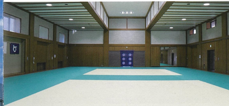
小道場(1)床面積540㎡(通常2面) ※288畳

床面積1,634㎡(通常6面、全国大会4面) ※660畳 観客席955席・身障者対応席6席