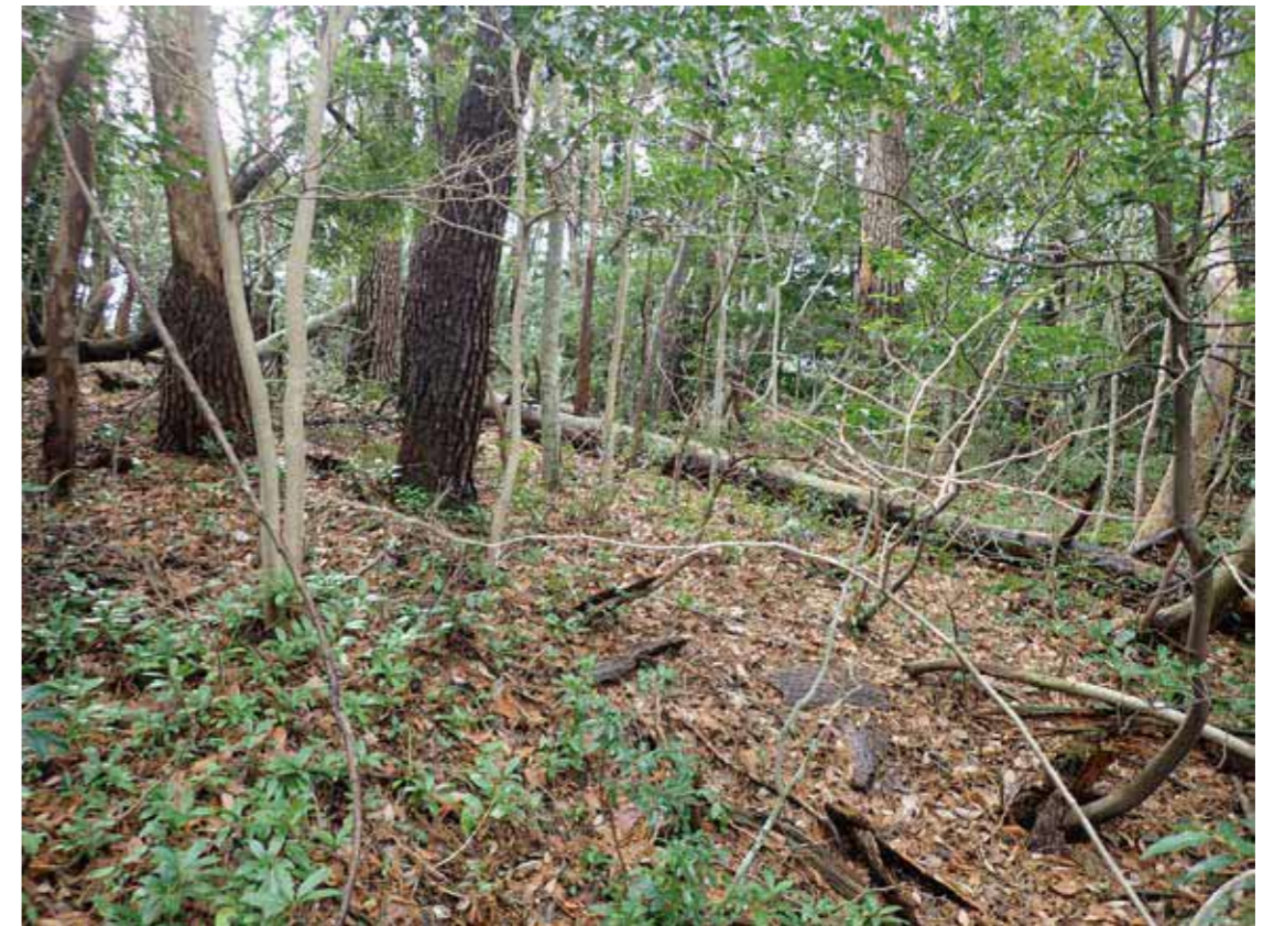
郭周囲の状況：不十分な加工