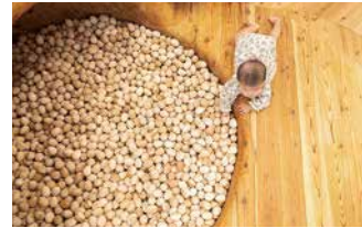
木の魅力を伝える 「徳島木のおもちゃ美術館」

徳島といえば「阿波おど り」や「鳴門の渦潮」… だけじゃないんです! 「木のおもちゃ美術館」 や「阿波十郎兵衛屋敷」 などのアートやカル チャーを体験できたり、 「阿波尾鷲」や「海賊料