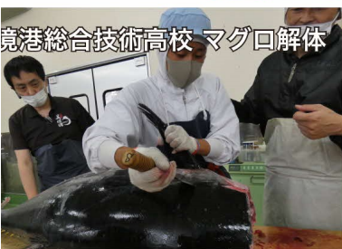
境港総合技術高校 マグロ解体