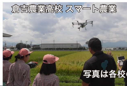
倉吉農業高校 スマート農業