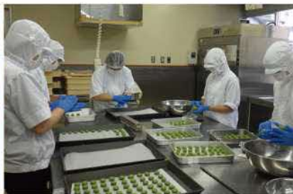
琴の浦高等特別支援学校