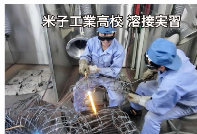
米子工業高校 溶接実習