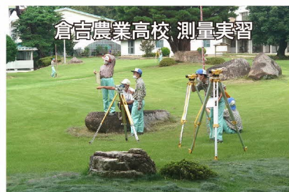
倉吉農業高校 測量実習