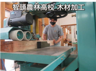
智頭農林高校 木材加工