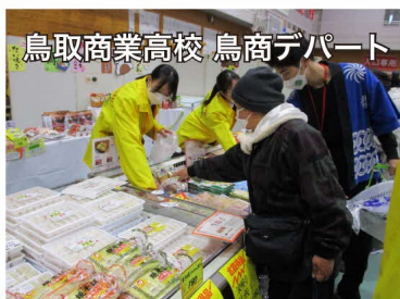
鳥取商業高校 鳥商デパート