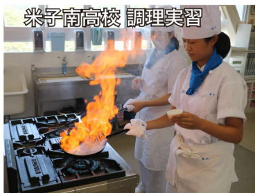
米子南高校 調理実習