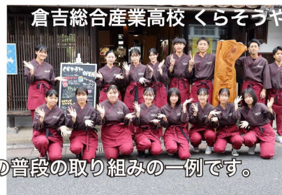
倉吉総合産業高校 くらそらや