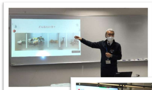
理科时间 生物的分类

☆这是一所鸟取县前所未有的公立初级中学，设置在鸟取市湖山町北的鸟取县教育センター情报教育楼 1 楼。夜校初级中学根据入学前的学习情况，施行适合每个学生的教学。使用电脑或平板电脑，每周上课 5 天，一天 4 小时。