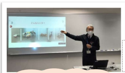
Trial class sa unang pagkakataon (December 2022)

☆Ito ay isang uri na hindi pa nakikita sa Tottori Prefecture. Ito ay matatagpuan sa ground floor ng information literacy section sa prefectural learning center sa hilagang Koyama-cho kita, Tottori City. Ito ay isang night school na idinisenyo upang tumanggap ng indibidwal na antas ng bawat mag-aaral mula sa simula ng pag-aaral. Ang mga aralin ay apat na oras bawat araw, limang araw bawat linggo, gamit ang isang computer o tablet.