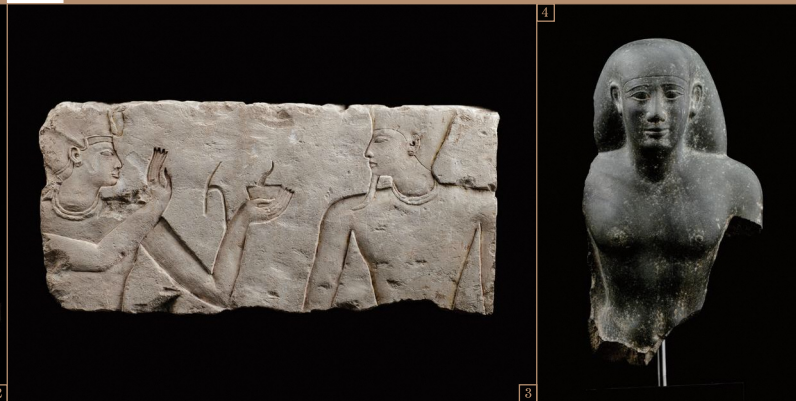
3. 王とアトゥム神のレリーフ / 第3中間期・第22王朝 4. 役人の胸像 / 末期王朝時代・第26王朝