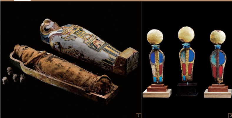
1. ホルスの4人の息子たちの護符とプタ・ハツカル・オシリス神のミイラ / 末期王朝～プトレマイオス朝時代 2. ウラエウス髪子装飾 / 新王国時代・第18王朝