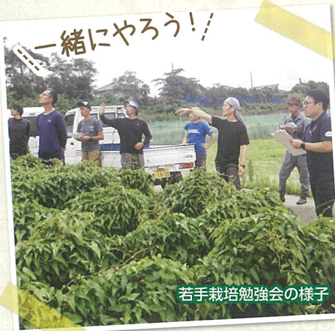
若手栽培勉強会の様子

芋は土の中ですが天候や圃場にも影響され、掘ってみるまでどんな芋ができていくかわからなくて不安ですが、大きな芋だったらすごく気持ちがよいです。(1ターン・50歳・栽培経験3年)