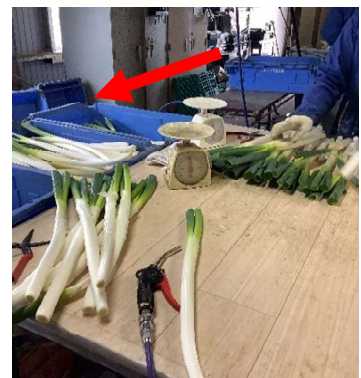
③選別は専属で実施