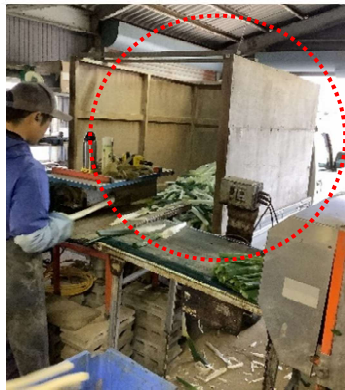
②残渣処理の効率化

可能な限りは場で外葉を剥いだ上で調製作業を行う。残渣の持ち込み量も減ることから清掃負担の軽減にも繋がる。