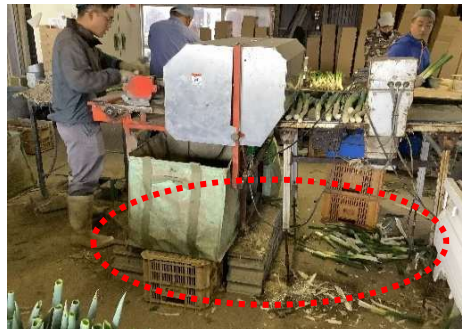
⑤作業台の高さ調整 (写真2枚)