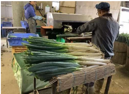
①皮剥ぎ作業の効率化

可能な限りは場で外葉を剥いだ上で調製作業を行う。残渣の持ち込み量も減ることから清掃負担の軽減にも繋がる。