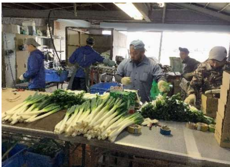
④結束から箱詰め作業の効率化