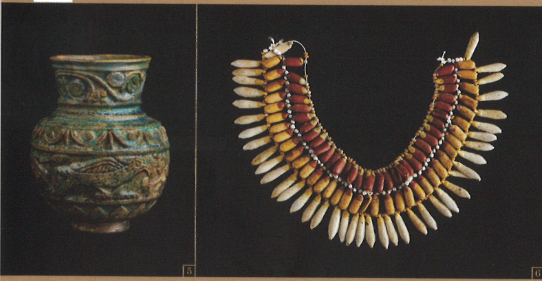
5. レリーフ装飾のある容器/ローマ支配時代 6. 花をモチーフにした胸飾り/新王国時代