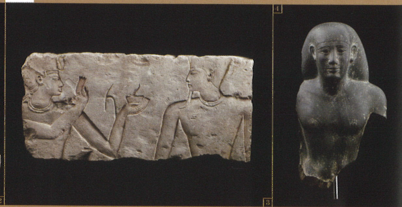
3. 王とアトゥム神のレリーフ/第3中間期・第22王朝 4. 役人の胸像/末期王朝時代・第26王朝