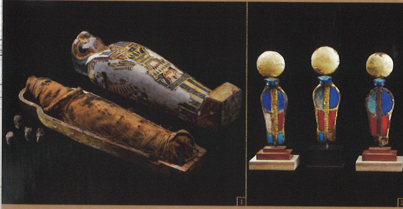
1. ホルスの4人の息子たちの護符とプタハ・ツカル・オシリス神のミイラ/末期王朝～プトレマイオス朝時代 2. ウラエウス扇子装飾/新王国時代・第18王朝