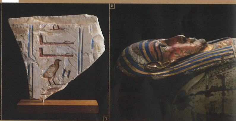
7. ヒエログリフが刻まれたレリーフ/末期王朝時代 8. 人型木棺/プトレマイオス朝時代初期