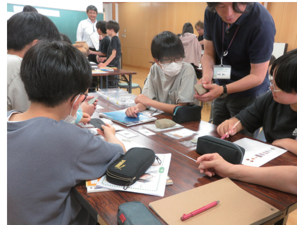
石器をよく観察してワークシートにまとめます。

出土品を観察して、どの時代にどんなことに使った道具かを子どもたちみんなで予想する授業を行っています。みんなで予想した後の答え合わせを行うことで大変盛り上がります。