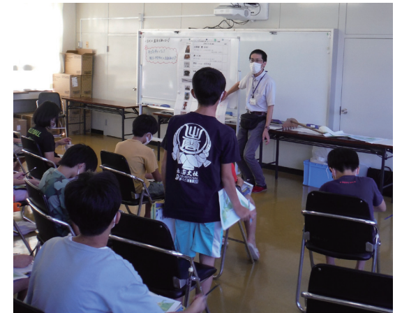
ワークシートにまとめた内容をもとに発表します。