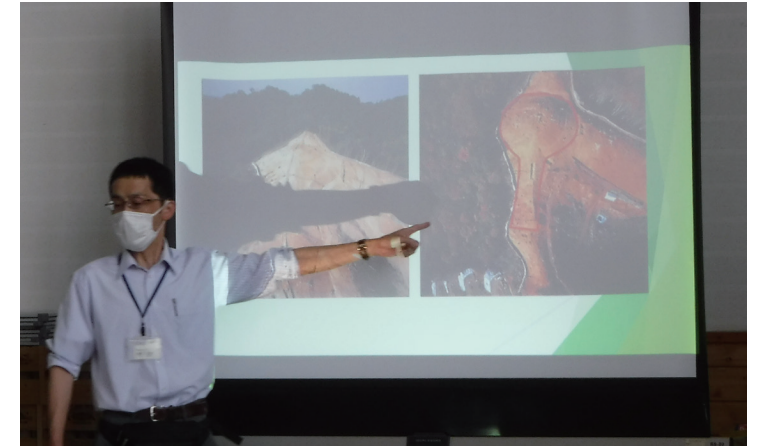
校区の古墳についての授業