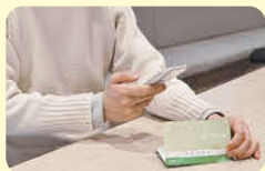
郵便物や書類の確認