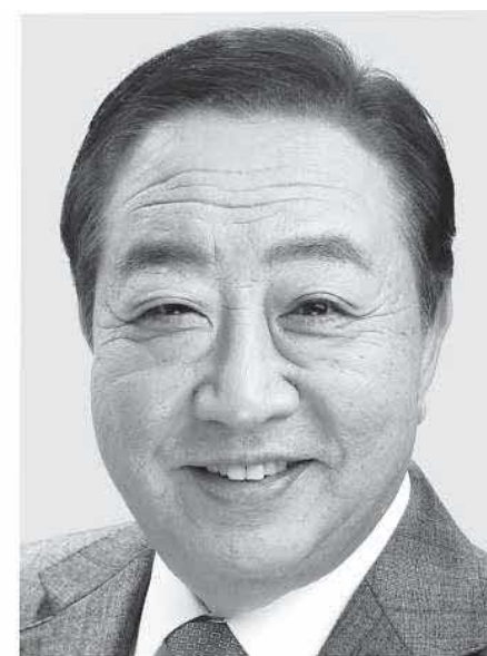
立憲民主党 代表 野田佳彦